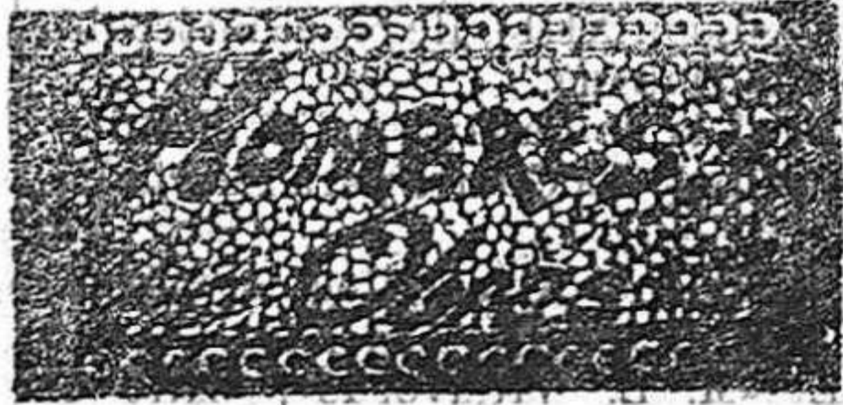
FRAY LUIS DE LEÓN.

exenciones temporales de tributa- ción para que se lograra orientar los capitales del ahorro, hoy inac- tivos ó lanzados á la especulación bursátil, en dirección á los gran- des problemas nacionales, de los cuales es uno de los mayores y más importantes el de los transportes interiores, sin cuya solución per- manecerán inexplotadas inmensas riquezas y seguirán siendo pobres comarcas que podrían ser ricas y el trabajo nacional perdiendo gran- des elementos sobre qué aplicar sus energías transformadoras.