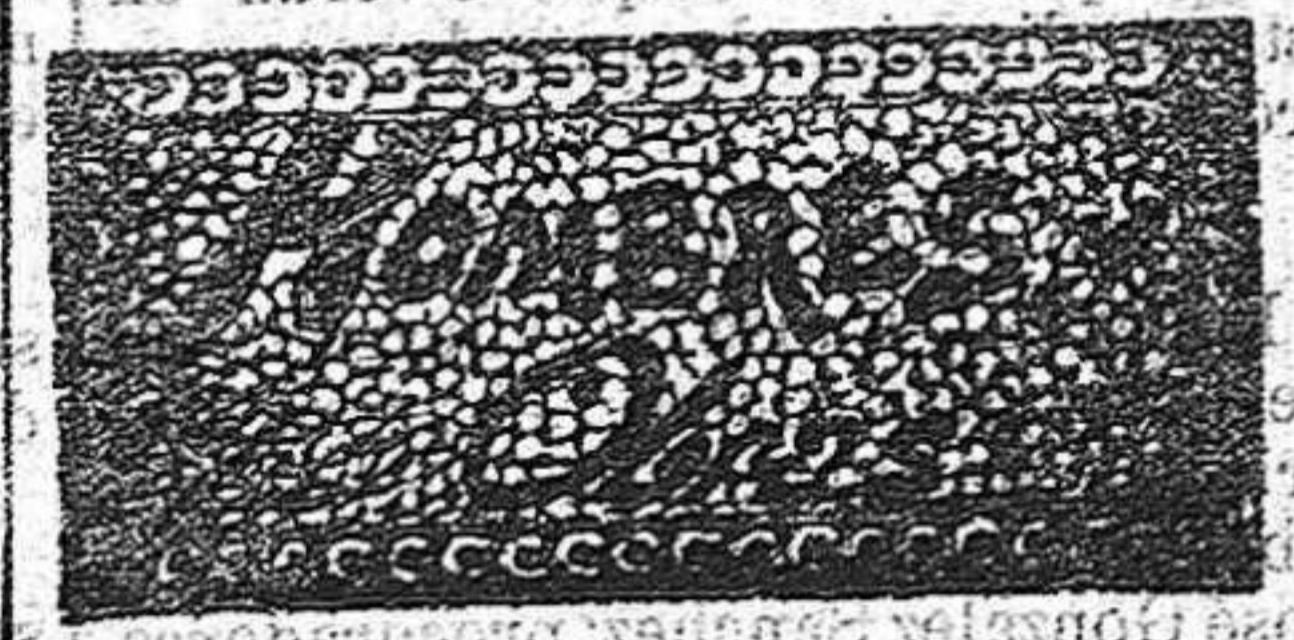
CARLOS COELLO. 12 DE AGOSTO.

Hay que ser previsores, sino se quieren tocar muchos males; la unión es la fuerza y uniéndose todos ahora, se lleva mucho adelantado. Previsión para mañana, previsión contra el mal, y el triunfo será para quien así escudado proceda.