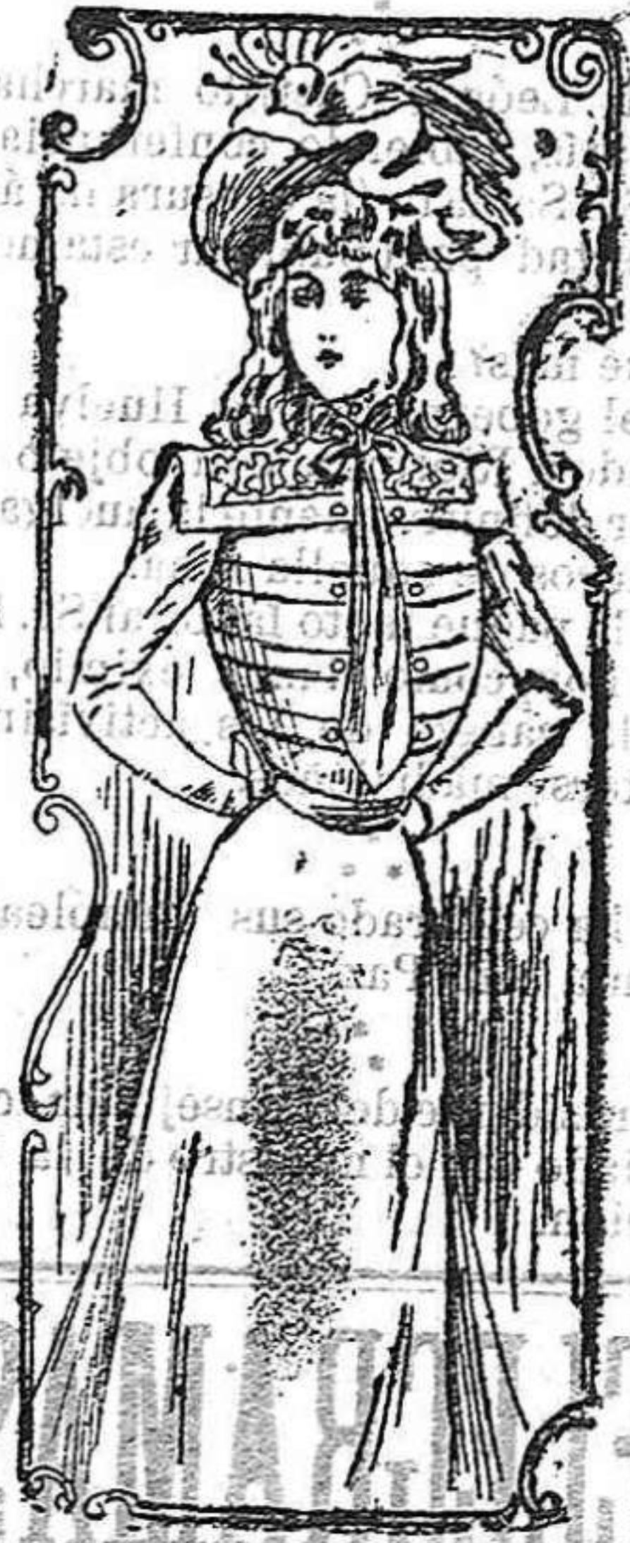
TRAJE PARA NIÑA DE 12 Á 14 AÑOS

MODELOS EXCLUSIVOS PARA NUESTRAS LECTORAS.