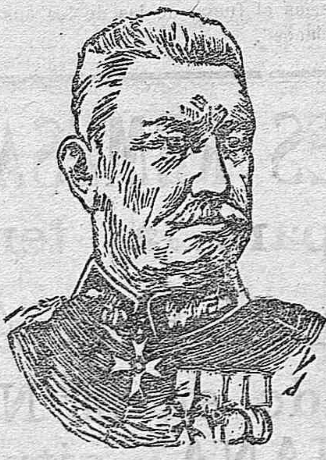
El general alemán von Bulow