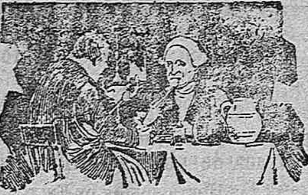
Comian hasta reventar y siempre sobraba.