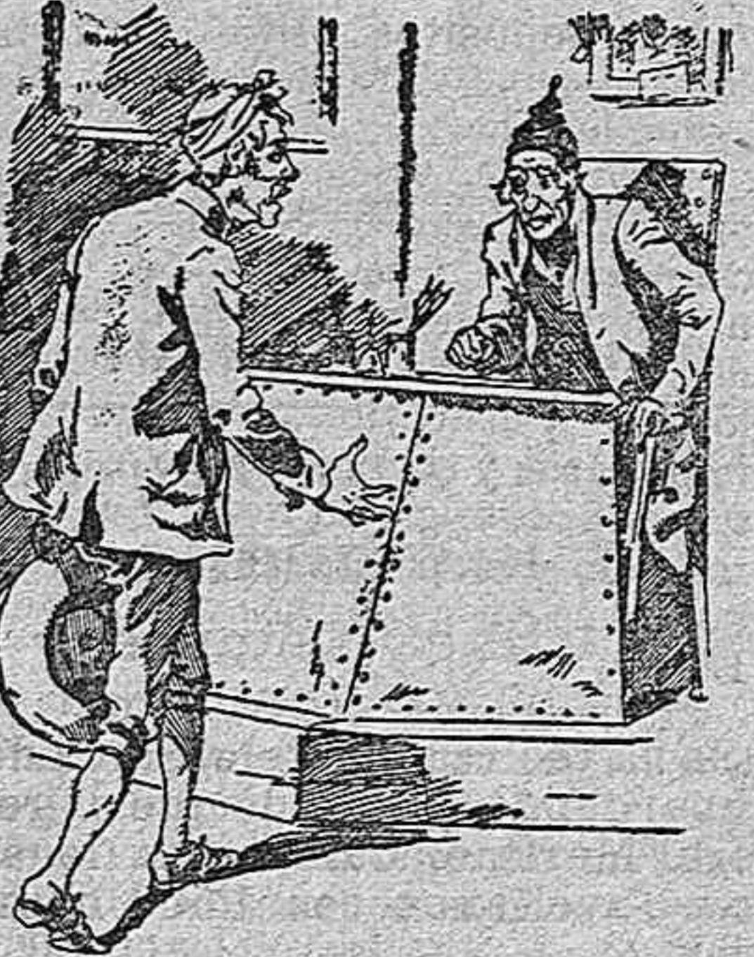
—Por favor y por... los réditos que quiera, présteme un duro para que no tengamos hambre en estos días.