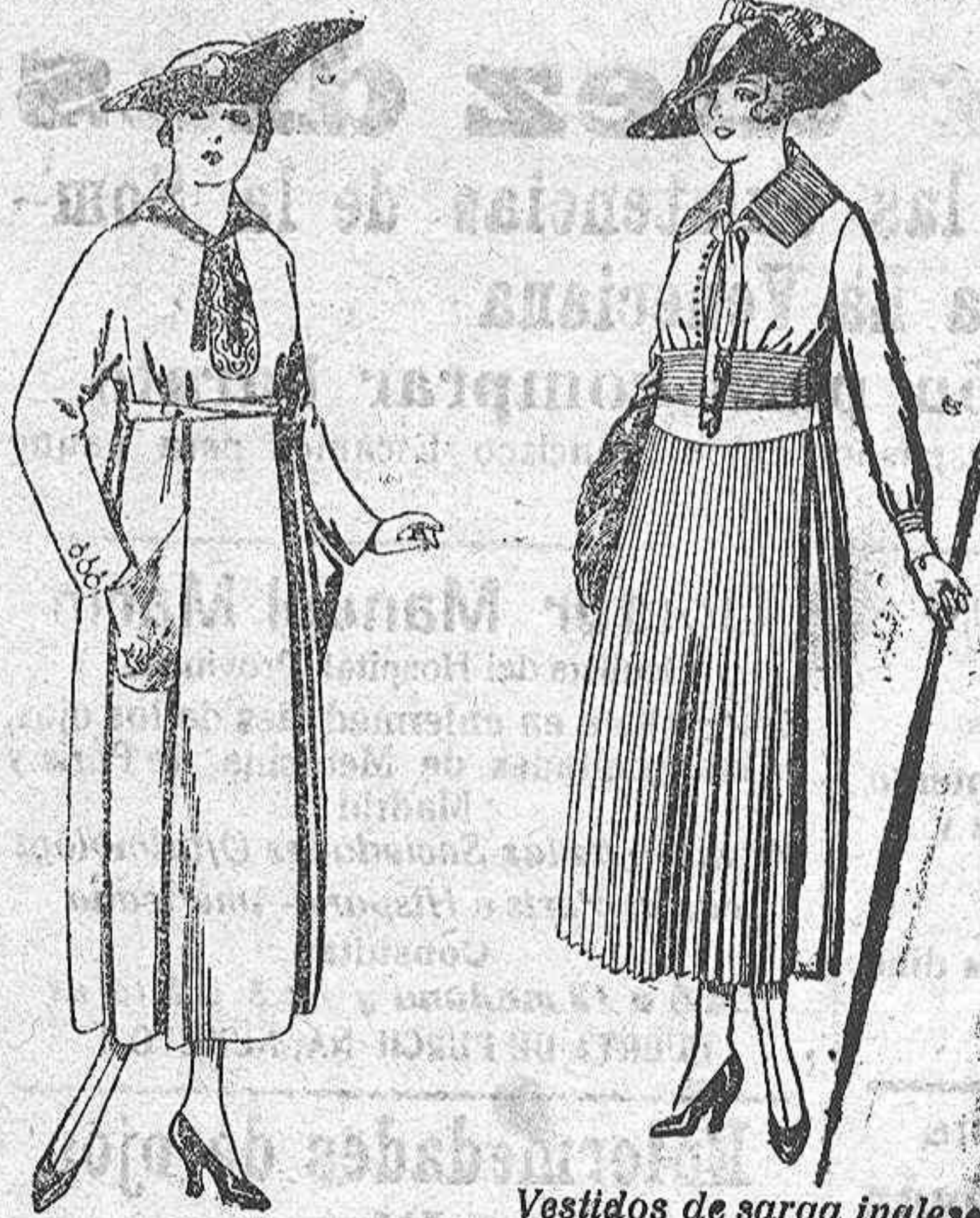
Vestidos de sarga inglesa, negro, azul y color, etc.

Gran exposición de artículos para la temporada.