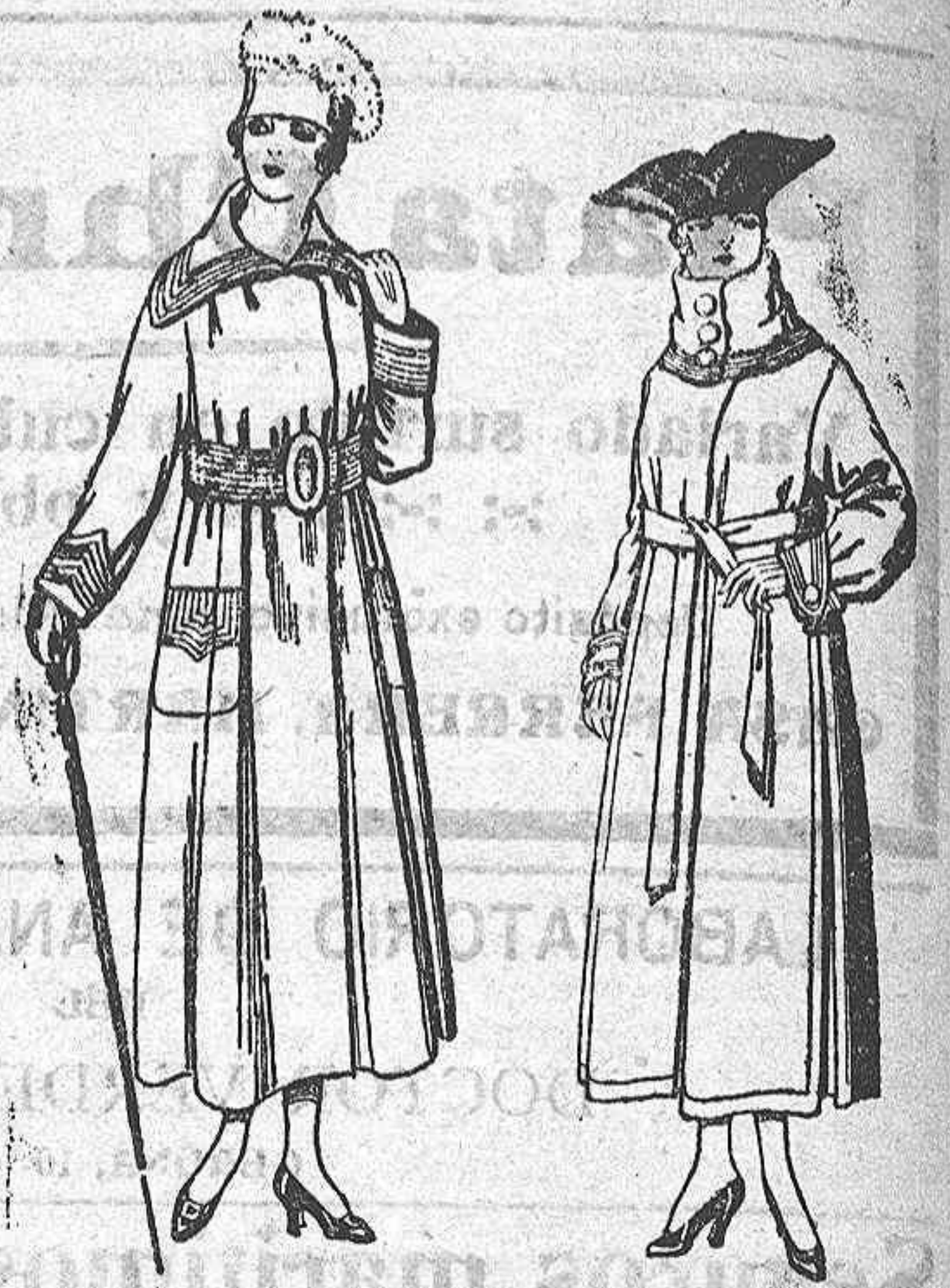
Abrigos de cheviot, gamuza, etc. De ptas. 50 a 60.

De ptas. 53 a 60. Los mismos, en punto de lana "Djers", bordado De ptas. 93 a 112.