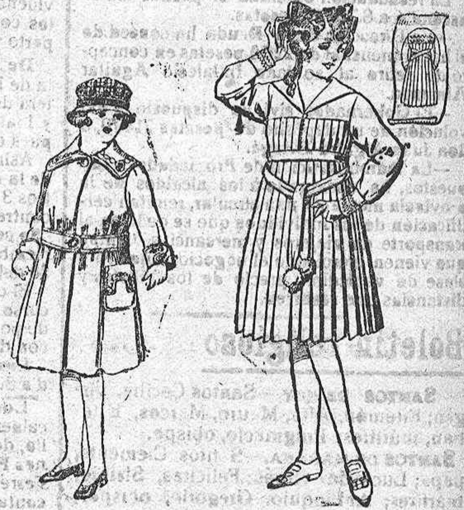
Abrigos de cheviot, pañete, etc., color, bordados, para niñas de 4 a 9 años. De ptas. 24 a 28.