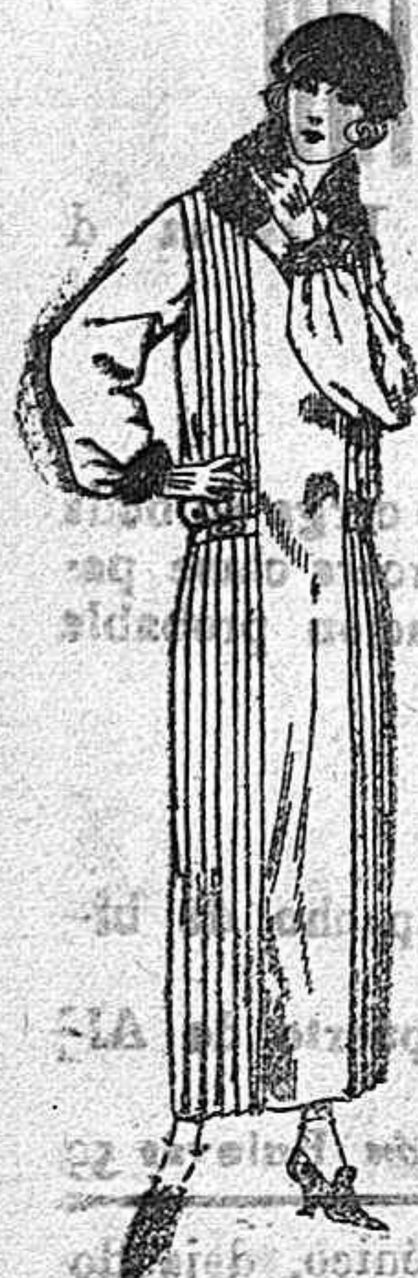
Vestidos de sarga crepé, etc. en negro azul y color de Pts. 125 a 60

SUCURSALES: Madrid, Barcelona, Alicante, Bilbao, Cadiz, Cartagena, Gijón, Granada, Málaga, Palma de Mallorca, Santander, Sevilla, Valencia, Valladolid, Zaragoza.