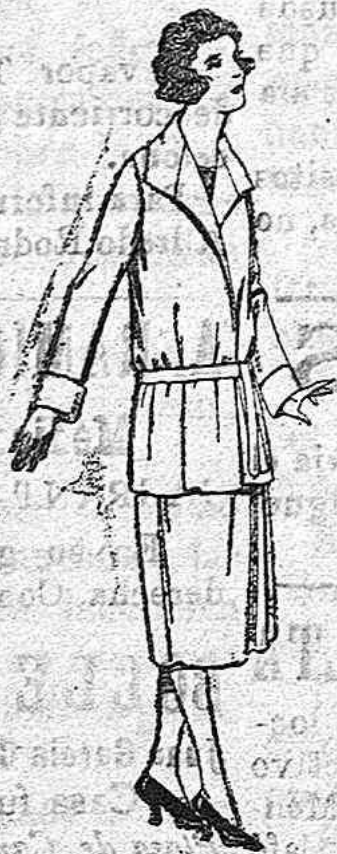
Trajes de estaño, lana, etc. en azul y color, para jovencitas de 12 a 15 años de Pts. 58 a 50