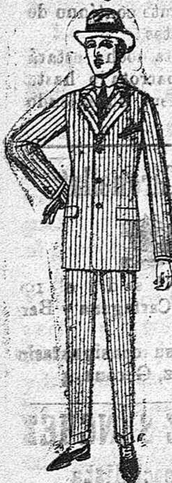
Trajes de cheviot paño, estambre, etc. de Pts. 33 a 135