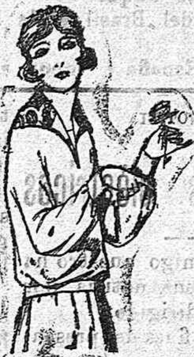
Buzas de punto de seda, diferentes colores, adornos bordados de Pts. 55 a 75