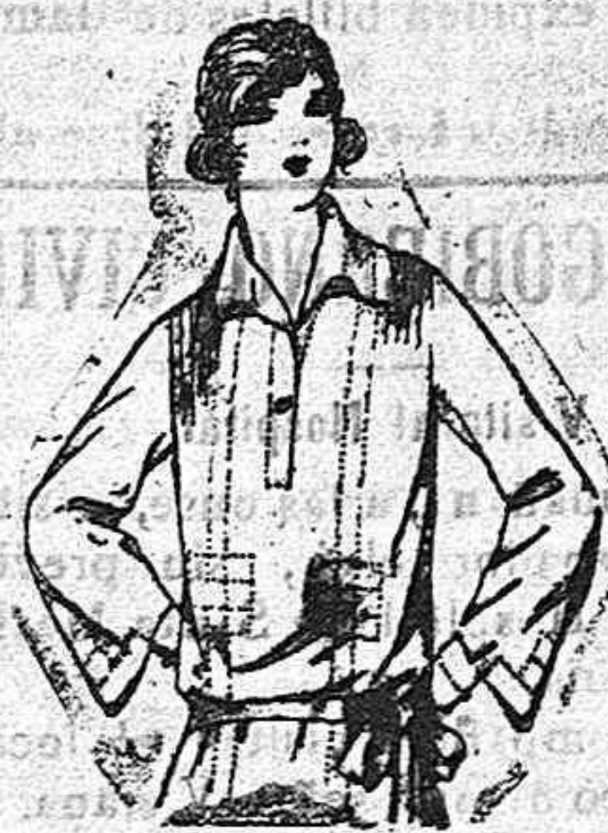
Blusas de crepón de seda de seda, en negro, azul y color, adornos calados de Pts. 30 a 65