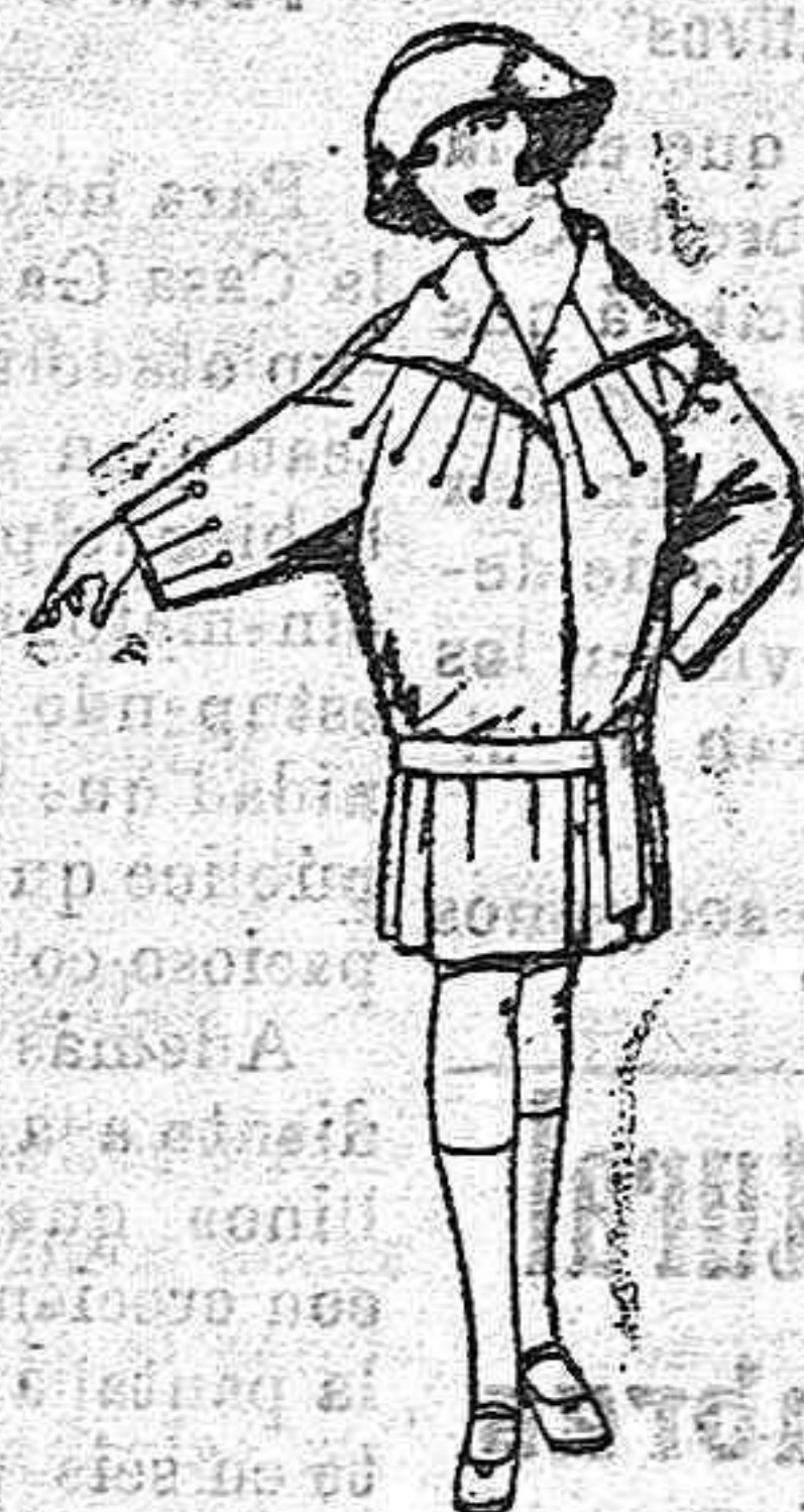
Abrigos de terciopelo de lana, azul y color, adorno respunte, niña 4 a 9 años Pts 25 a 50

Ropas confeccionadas para Caballero Señora Niño y Niña