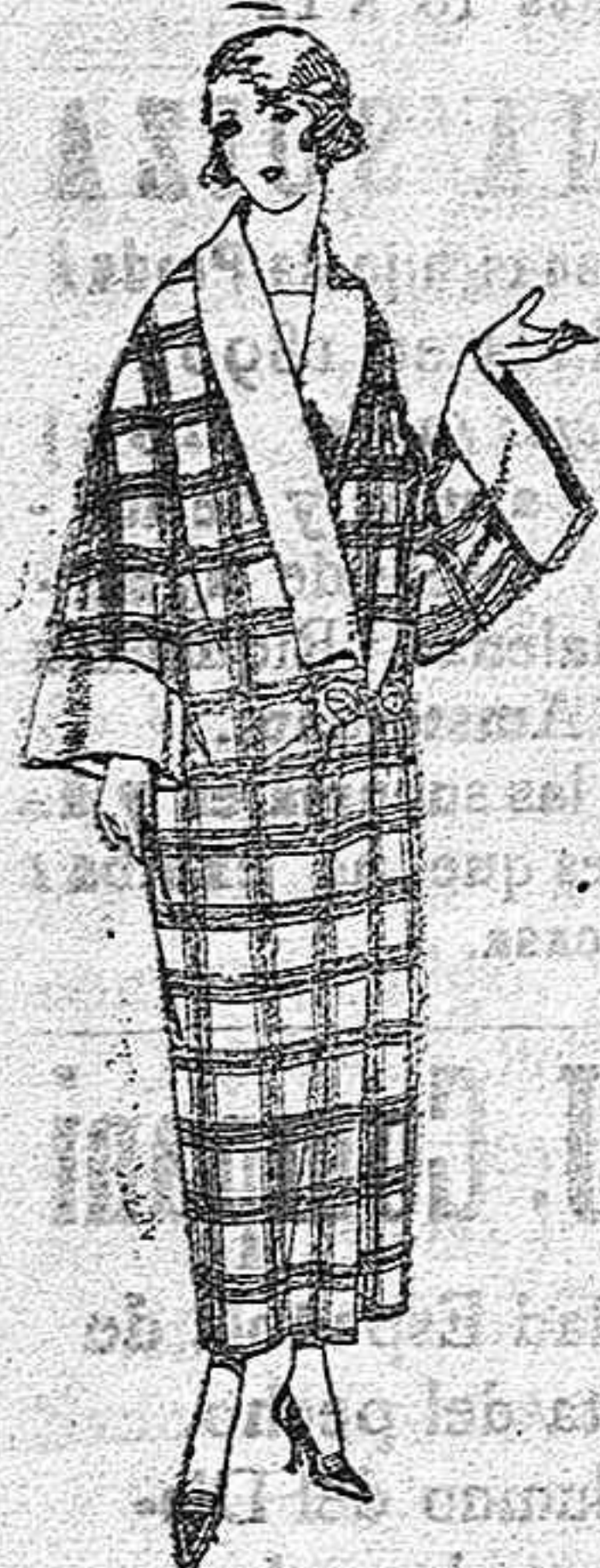
Batas de franela dibujos novedad de ptas 27 a 38

Ropas confeccionadas para Caballero Señora Niño y Niña