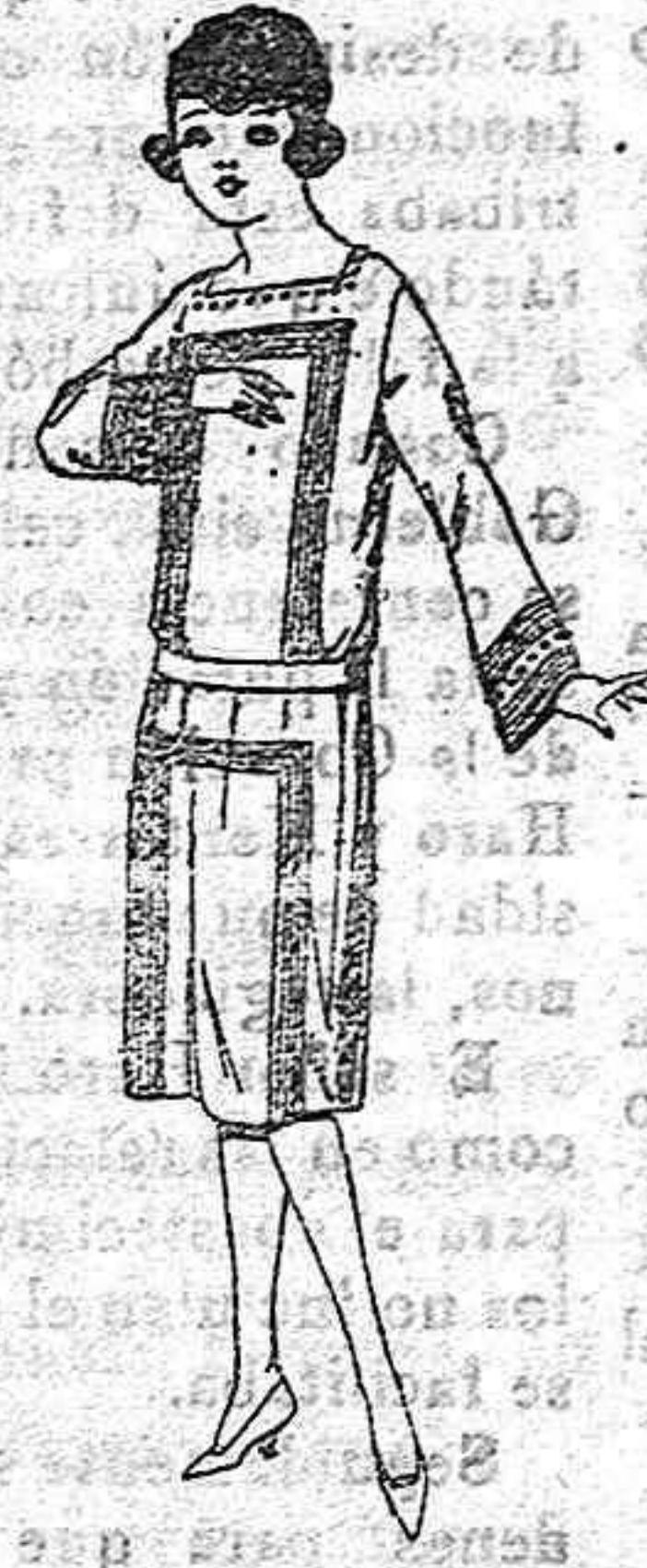
Vestidos de sarga inglesa, gabardina, en azul y color, para jovencitas de 12 a 15 años de Pts. 60 a 80