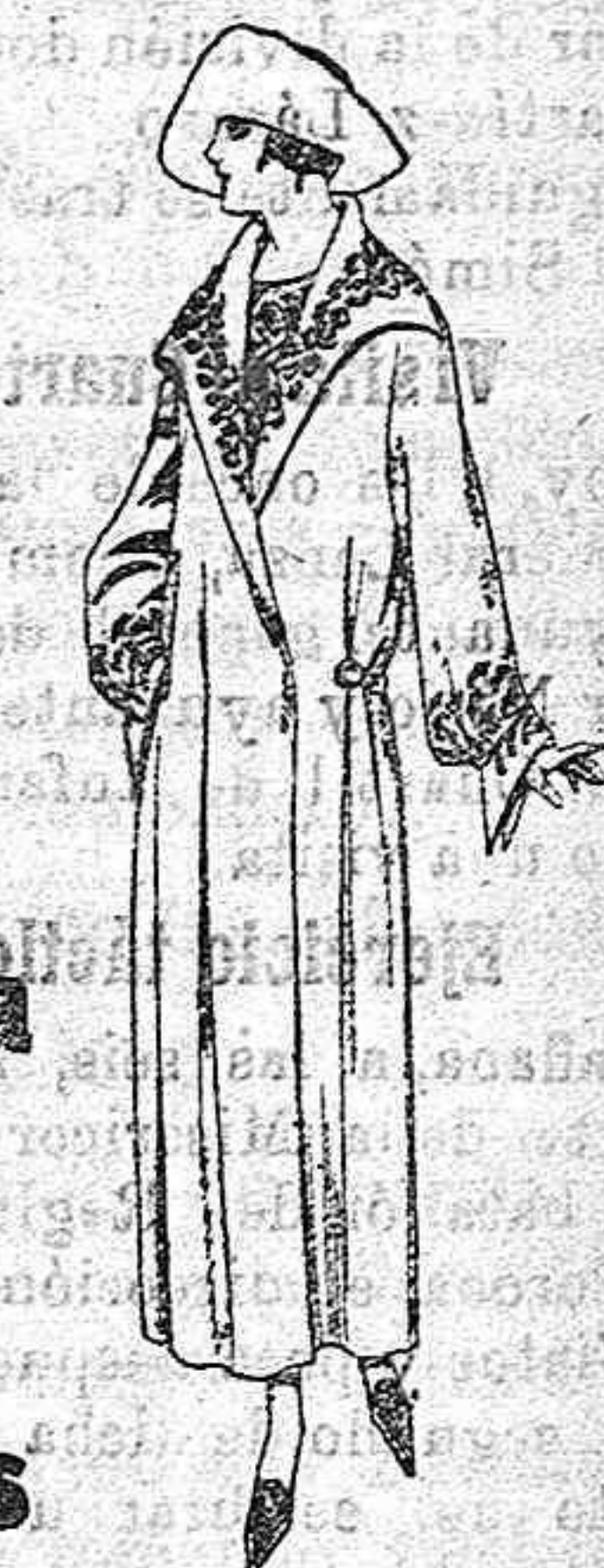
Abrigos de terciopelo de lana, gamuza, paño, etc. en azul, negro y color adornos bordados de Pts. 80 a 95

Peletería, Camisería Géneros de punto Corbatería, guantería, Sombrerería, Zapatería, Paraguas Bastones y artículos de viaje