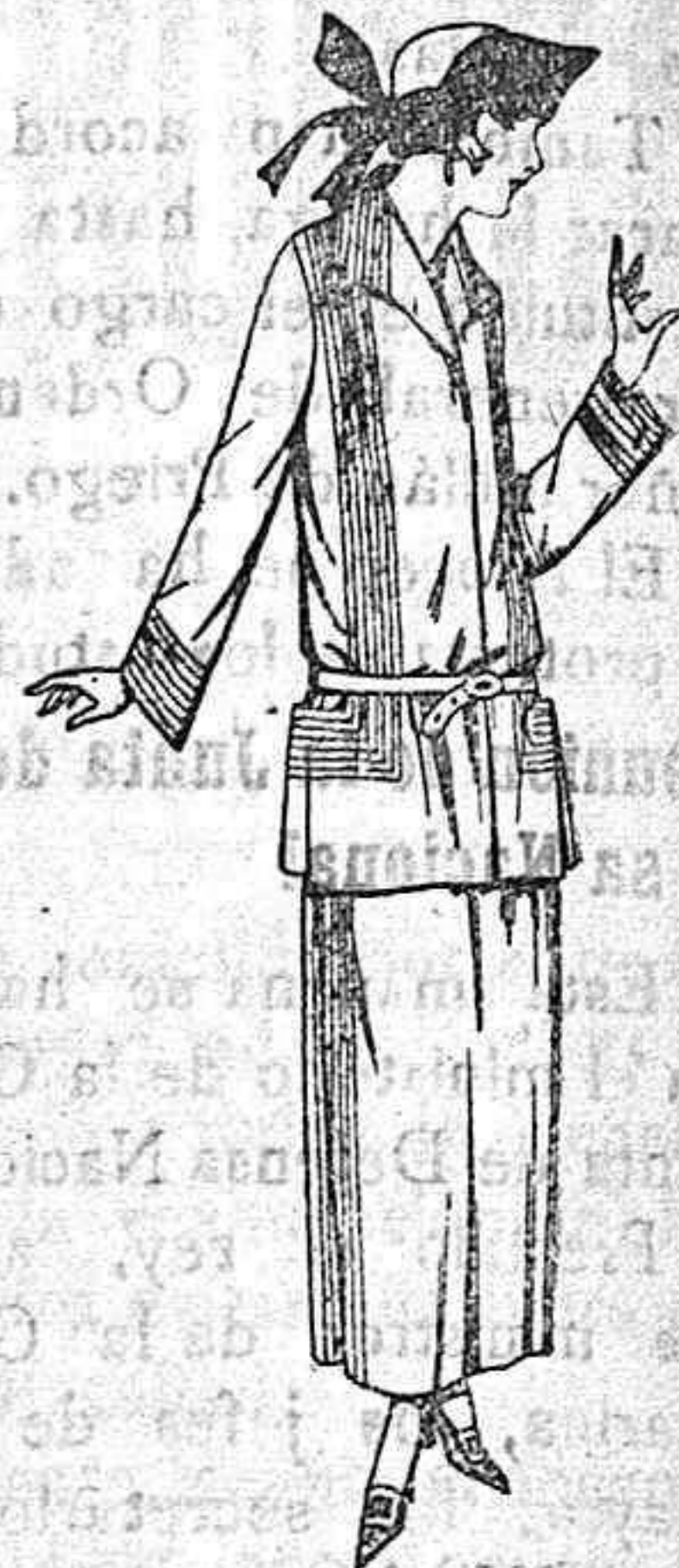
Trajes sastre, de peletería, estambre, en marino, negro y colores moda de Pts. 125 a 160