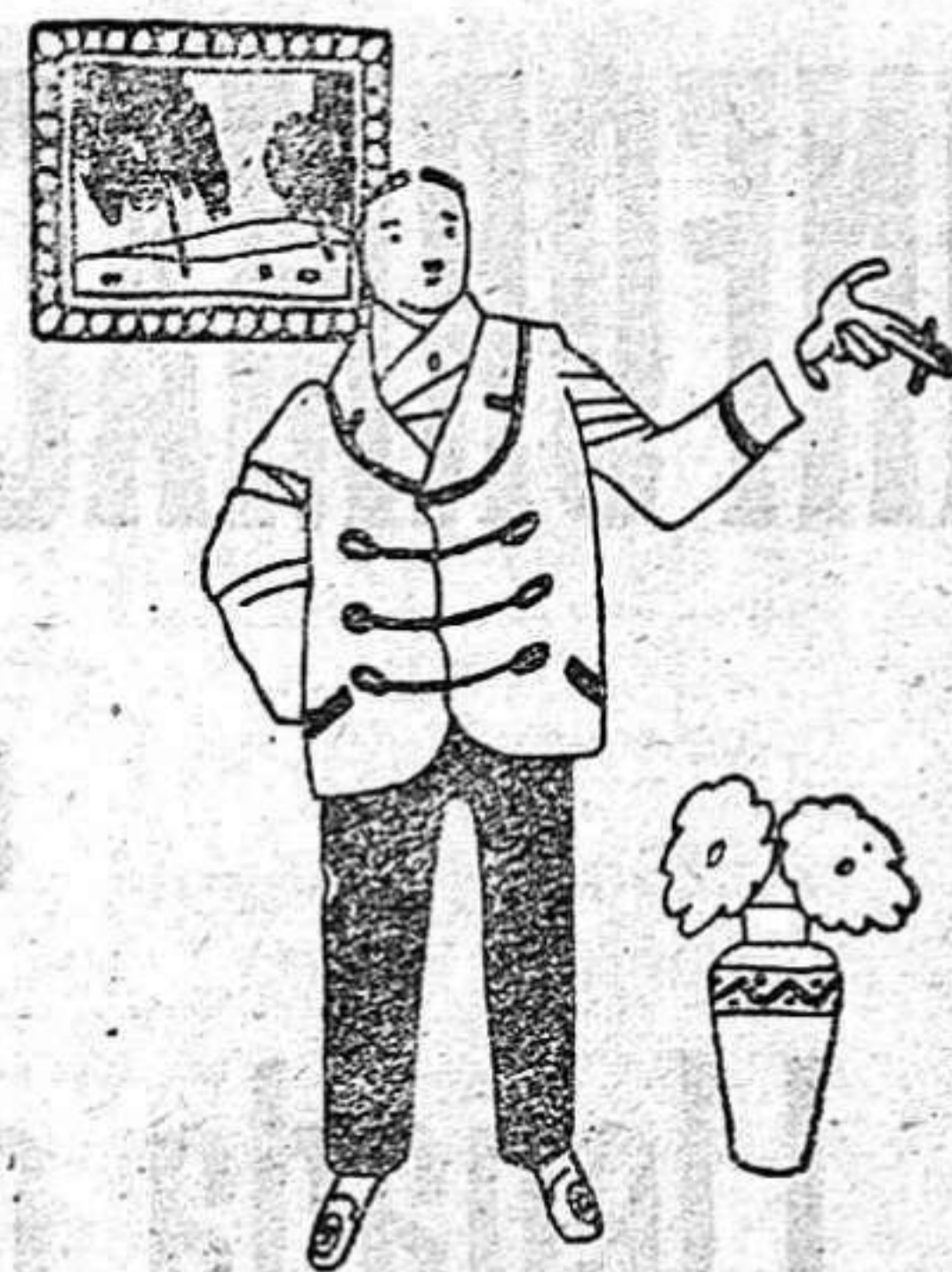
Del mundo la mejor cosa es el papel INDIO ROSA.