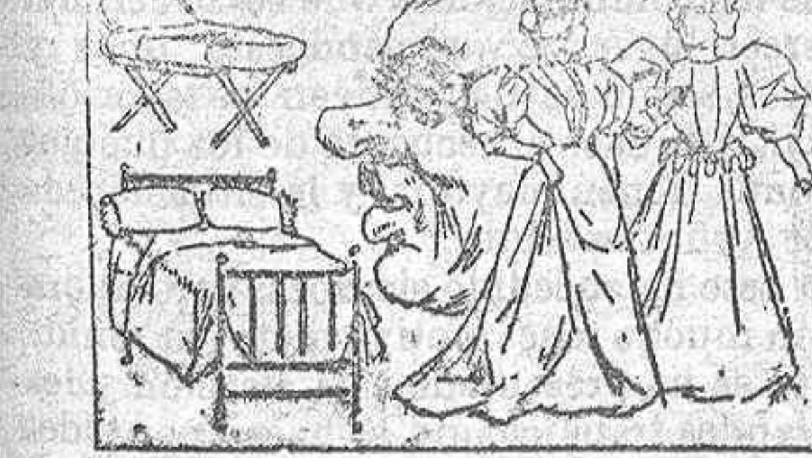
(Lectura de la charada)