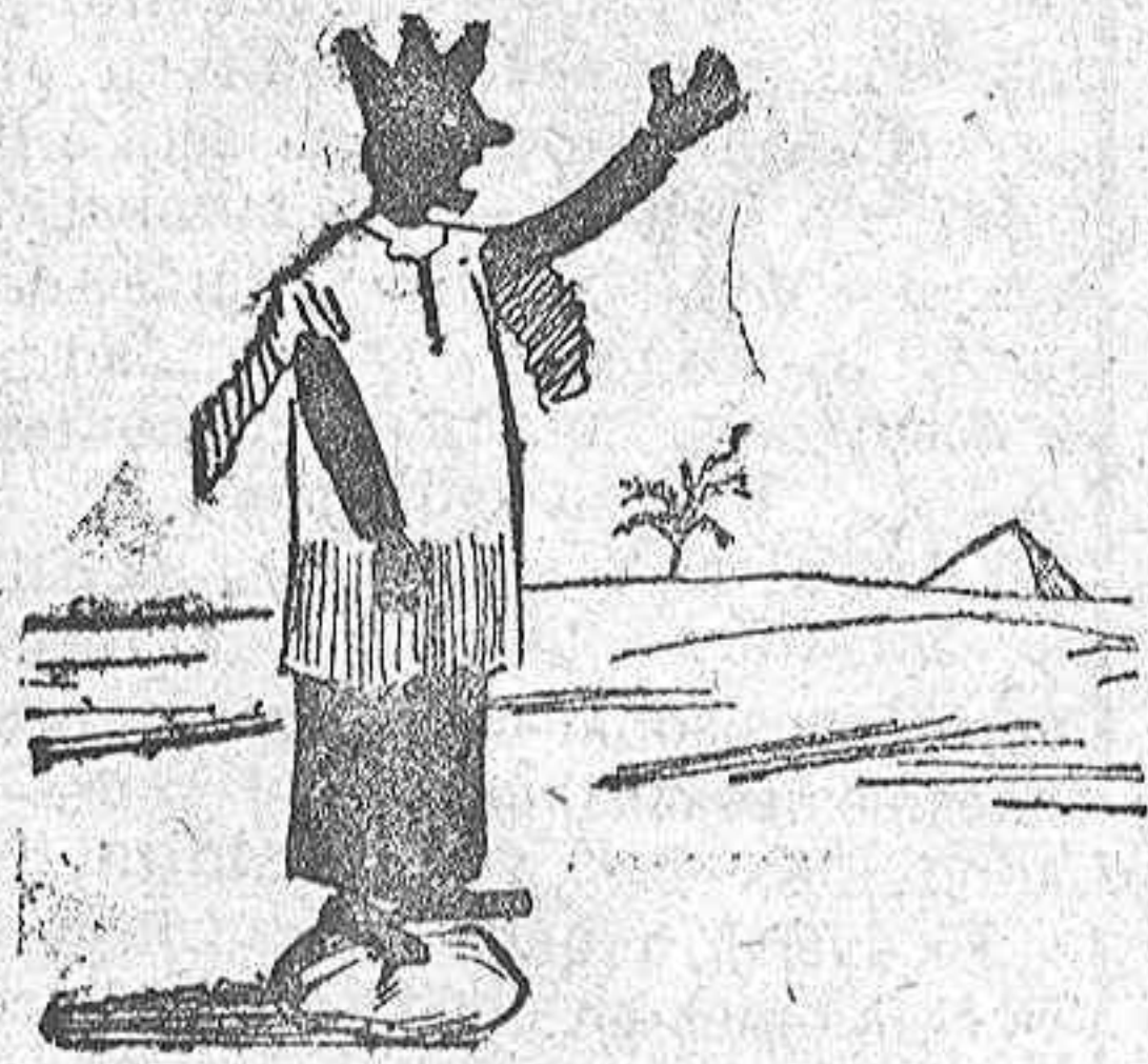
(La solución mañana).