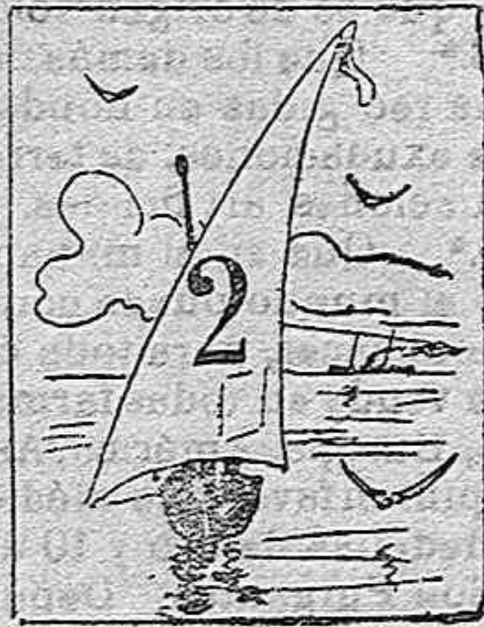
(La solución mañana.)

Solución á la charada de ayer: Camandulero. JEROGLIFICO COMPRIMIDO.