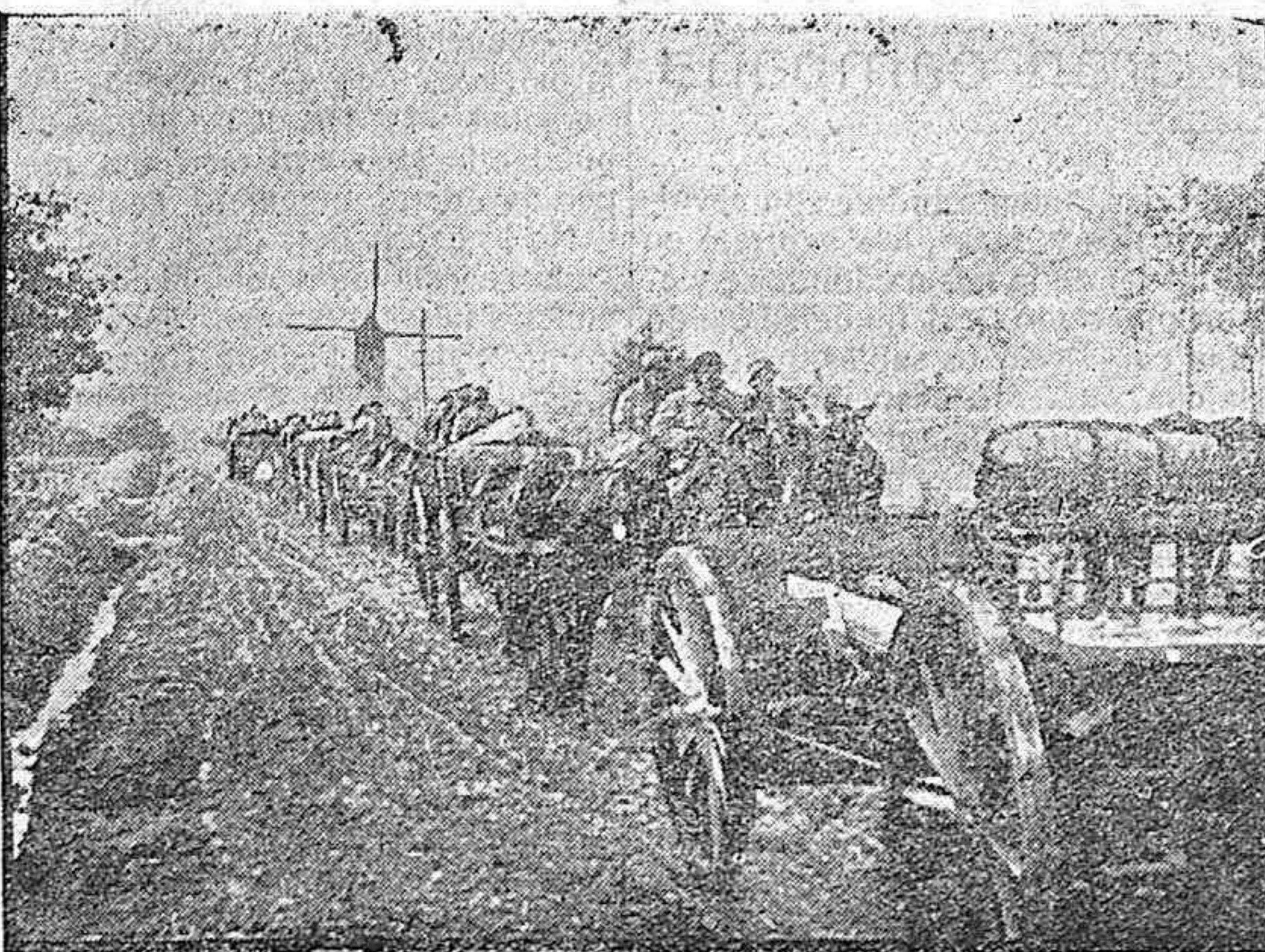
EN FLANDES.—CONVOY DE ARTILLERÍA