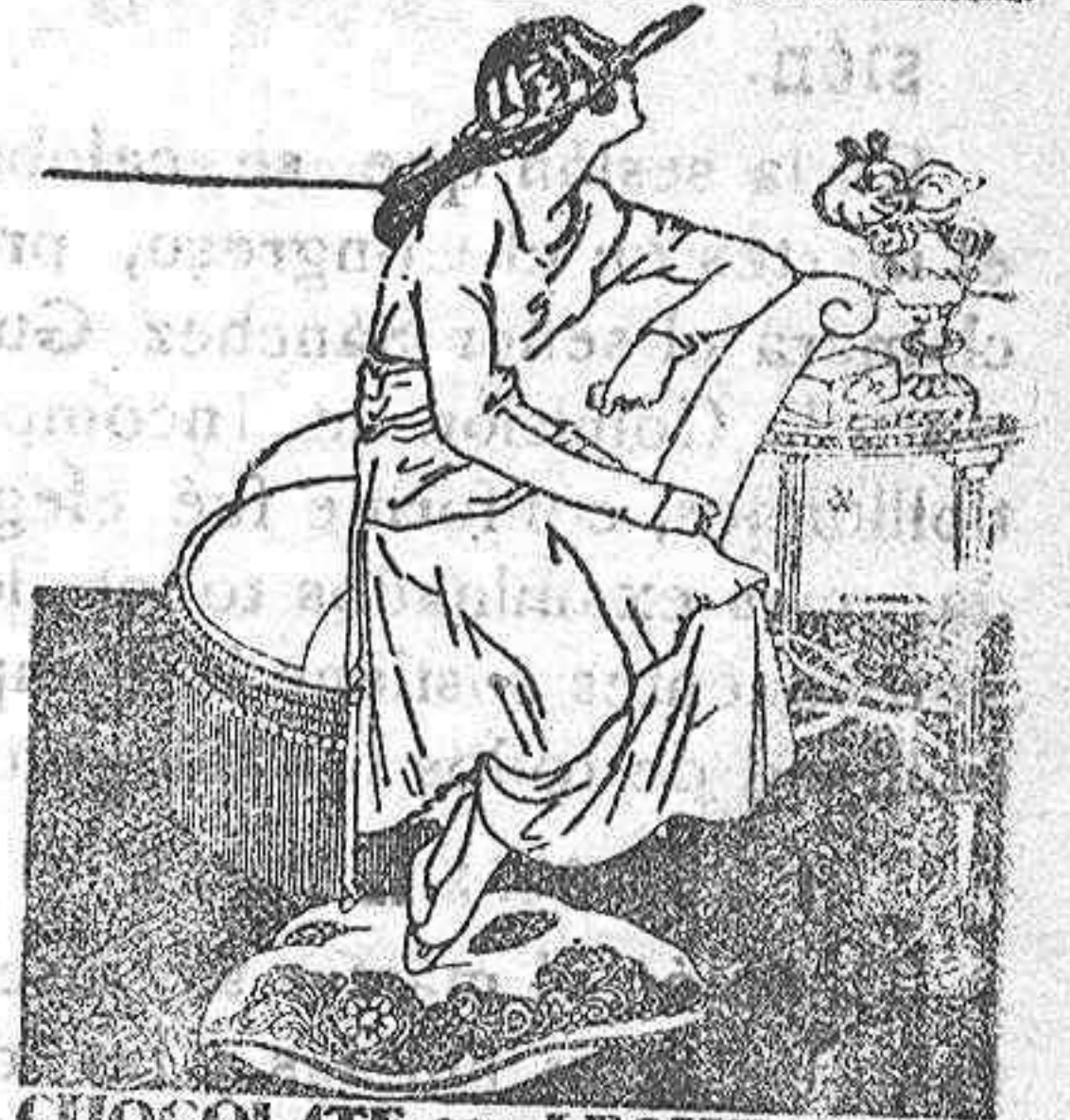
CHOCOLATE CON LECHE SUIZA

El único que gastan las personas distinguidas.