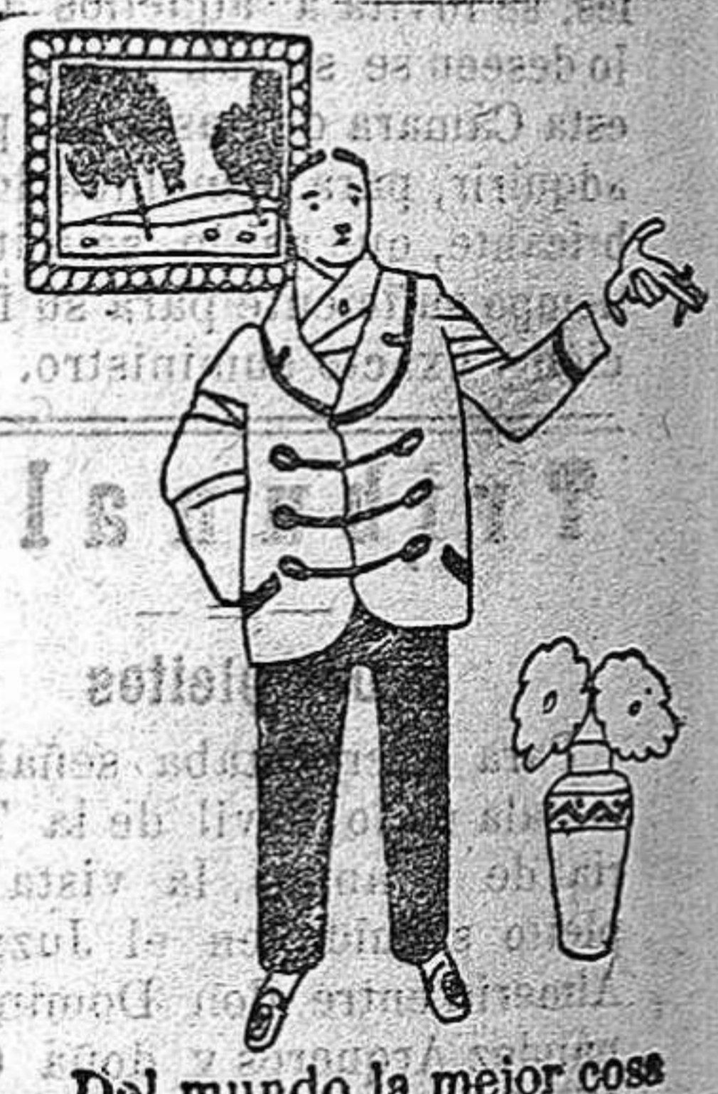
Del mundo la mejor cosa es el papel INDIO ROSA.