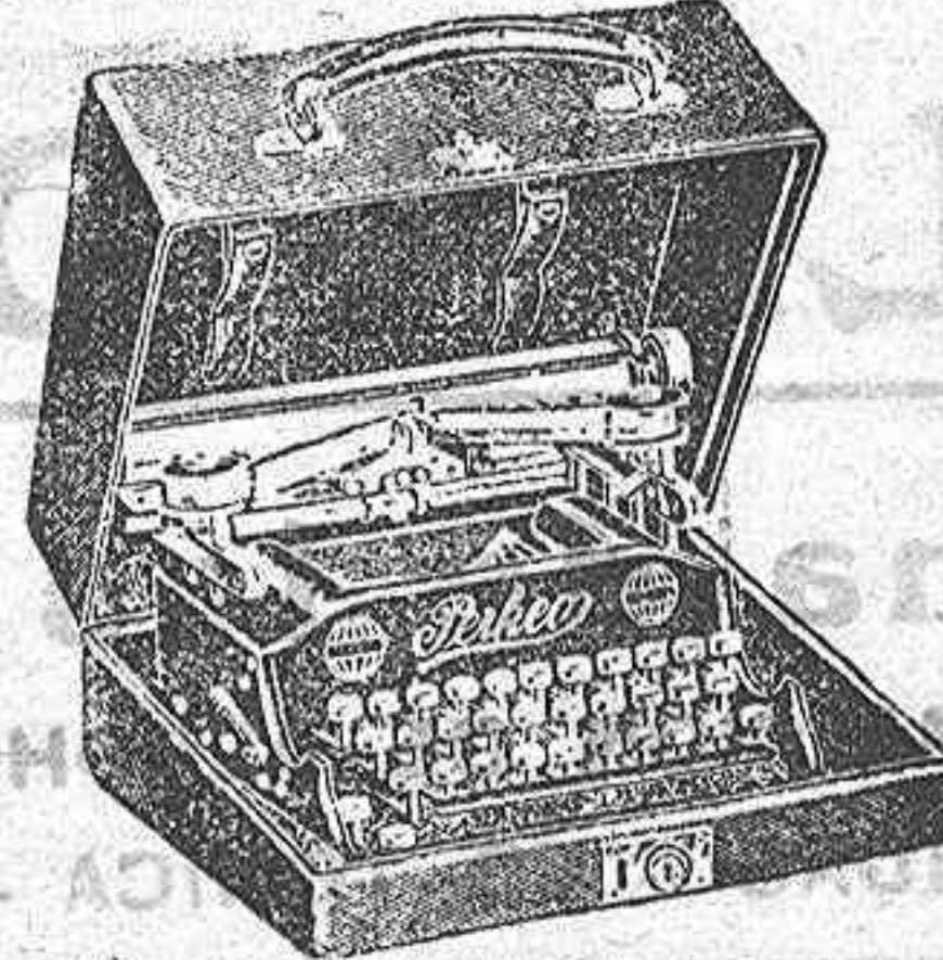
La más indicada para uso particular, pequeños negocios y viaje

Campeón mundial de resistencia Ventas a plazos, cambios, etcétera. CASA SEMPERE. — ALMERÍA