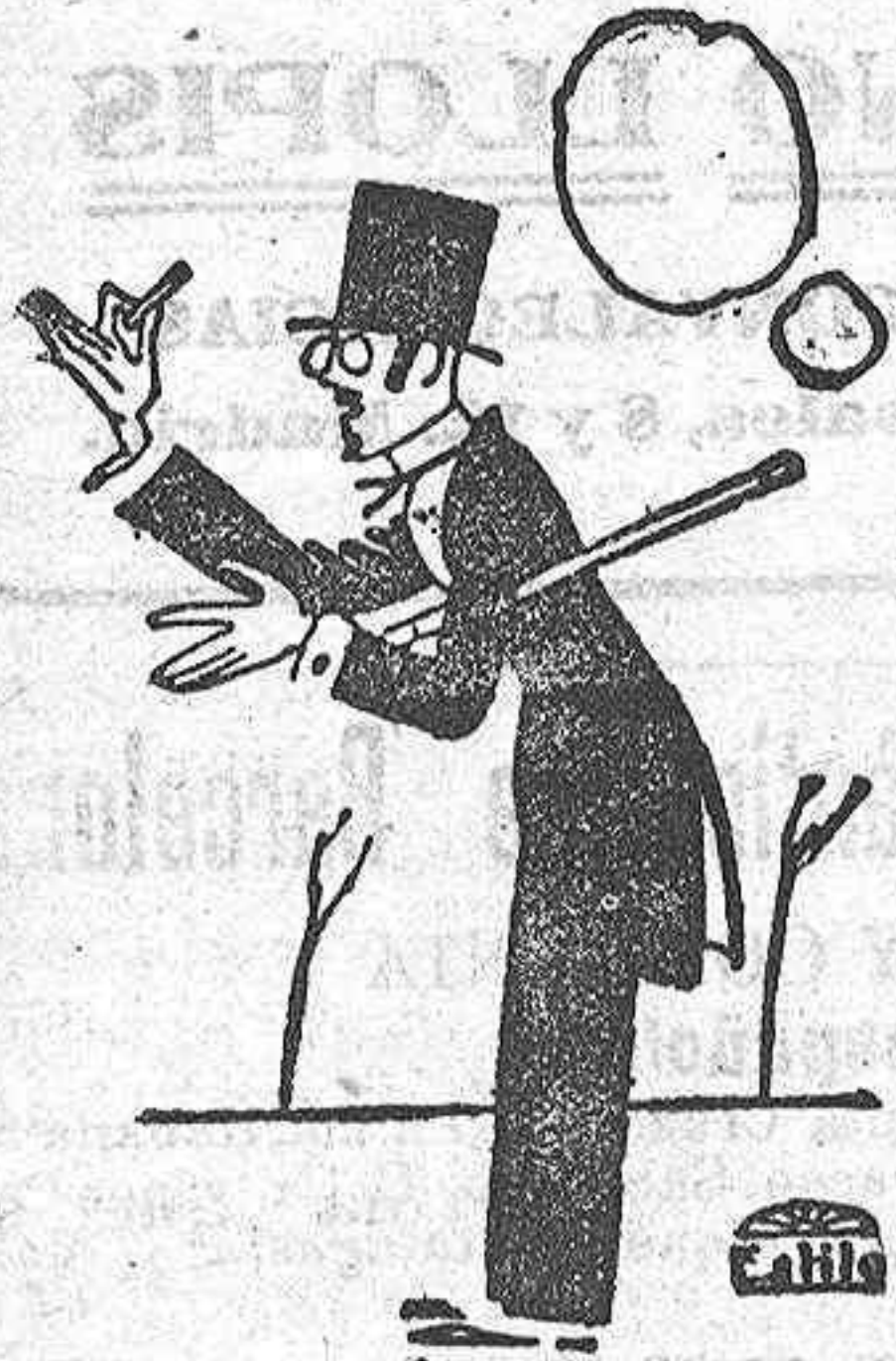
El que prueba el Indio Rojo se acostumbra tanto a él que enseguida lo proclama el rey de todo papel.