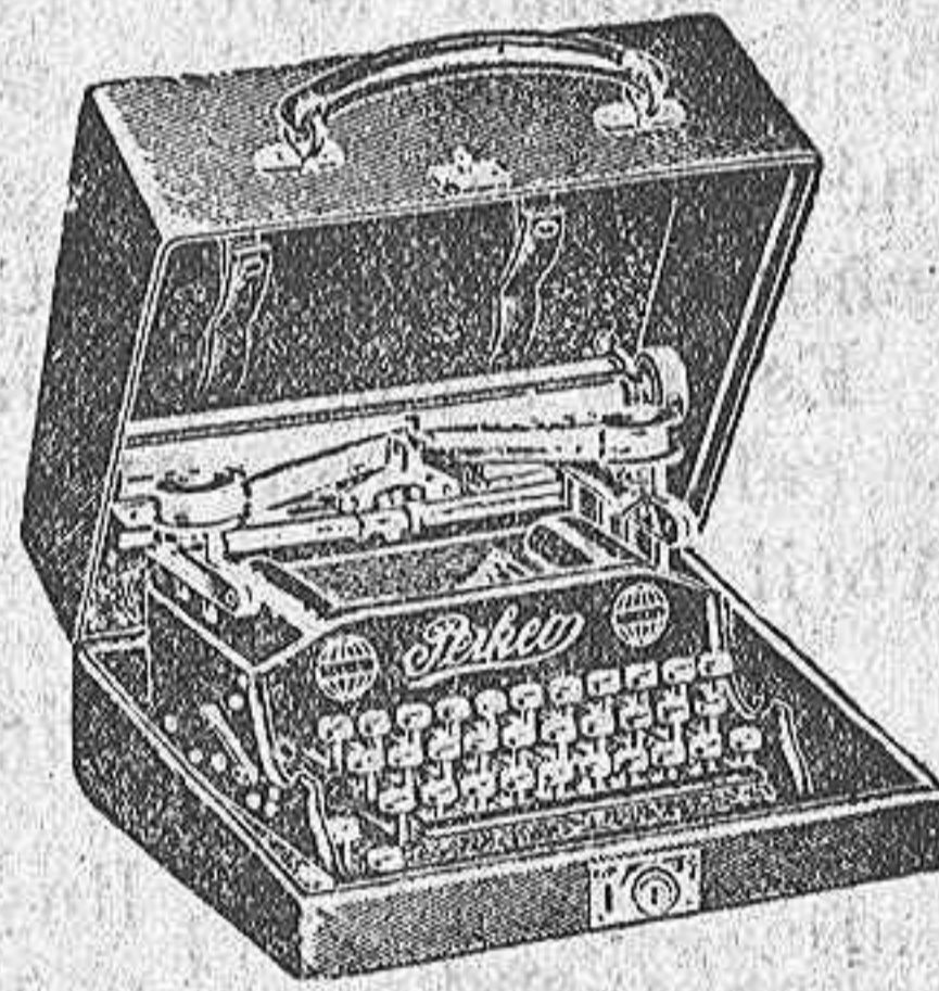
La más indicada para uso particular, pequeños negocios y viaje