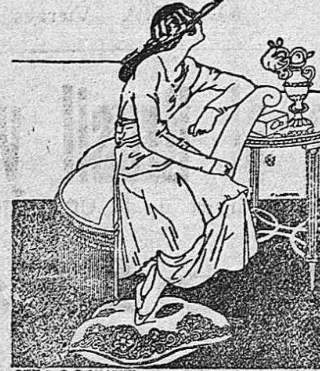
CHOCOLATE CON LECHE SVIZA

El único que gastan las personas distinguidas y que regala participaciones de la