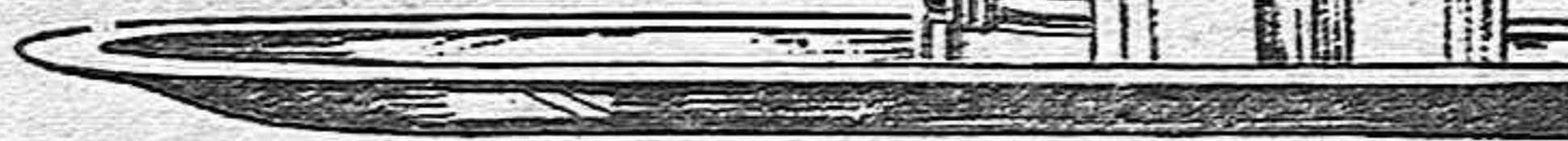
(Marca y botella registradas)