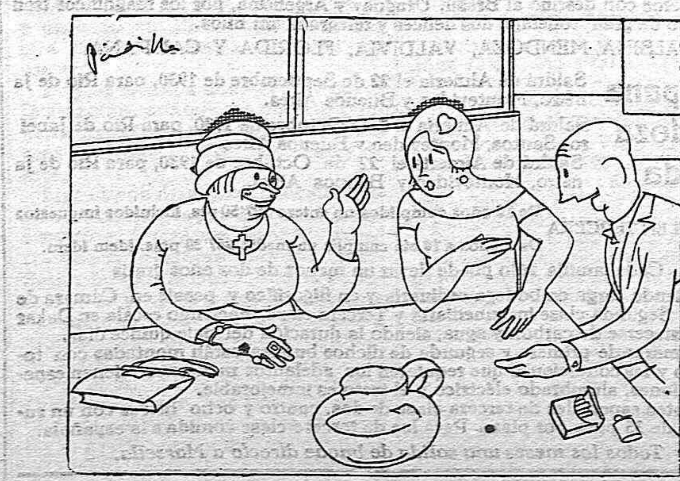
LOS NUEVOS RICOS

—Y usted señora. El «cock tails» lo quiere con huevos ¿verdad? —No, no. Con una buena ración de callos.