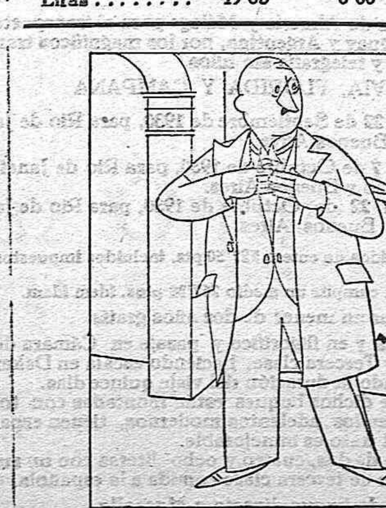
TODO UN HOMBRE

EL INVITADO. — Ya estará la casa llena de imbéciles ¿verdad? LA DONCELLA. — No, señor. Usted es el primero que llega.