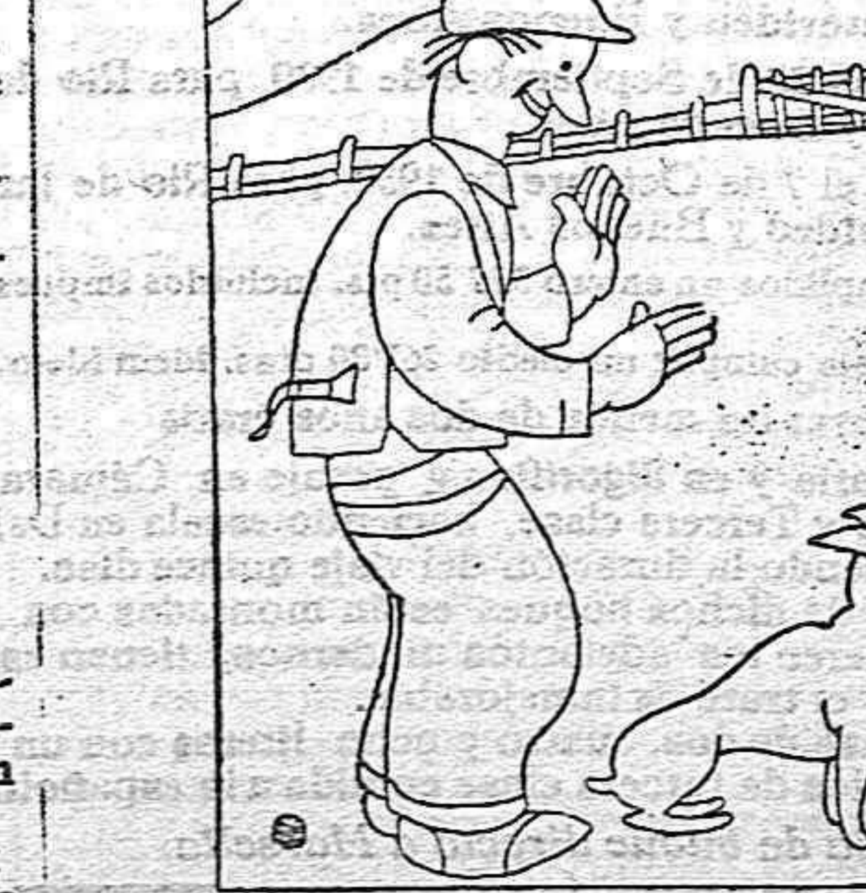
EL AMIGO DEL HOMBRE

—Este perro me servirá para sereno? —Magnífico. En cuanto oiga usted el menor ruido le despierta y ya verá cómo ladra.