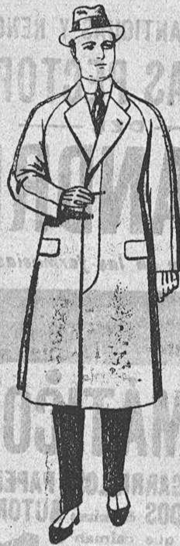
Gabanes de patén, meltón o cheviot, con forro de seda o satén; de ps. 65 a 115