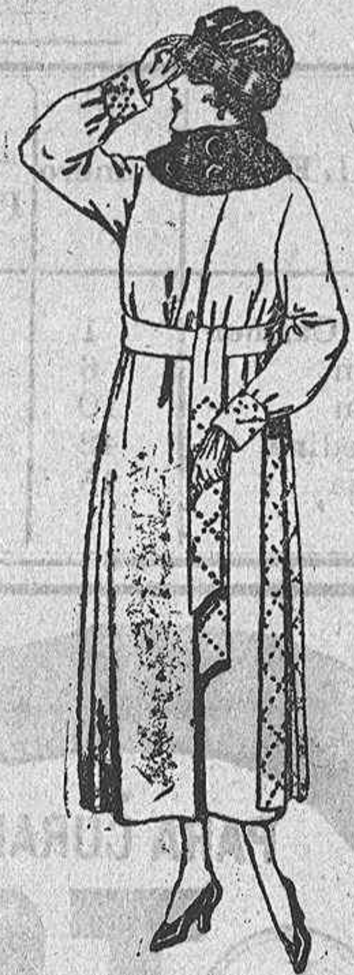
Abrigos de pañete gamuza, etc., en negro, azul y color, cuello piel. De ptas. 100 a 120.