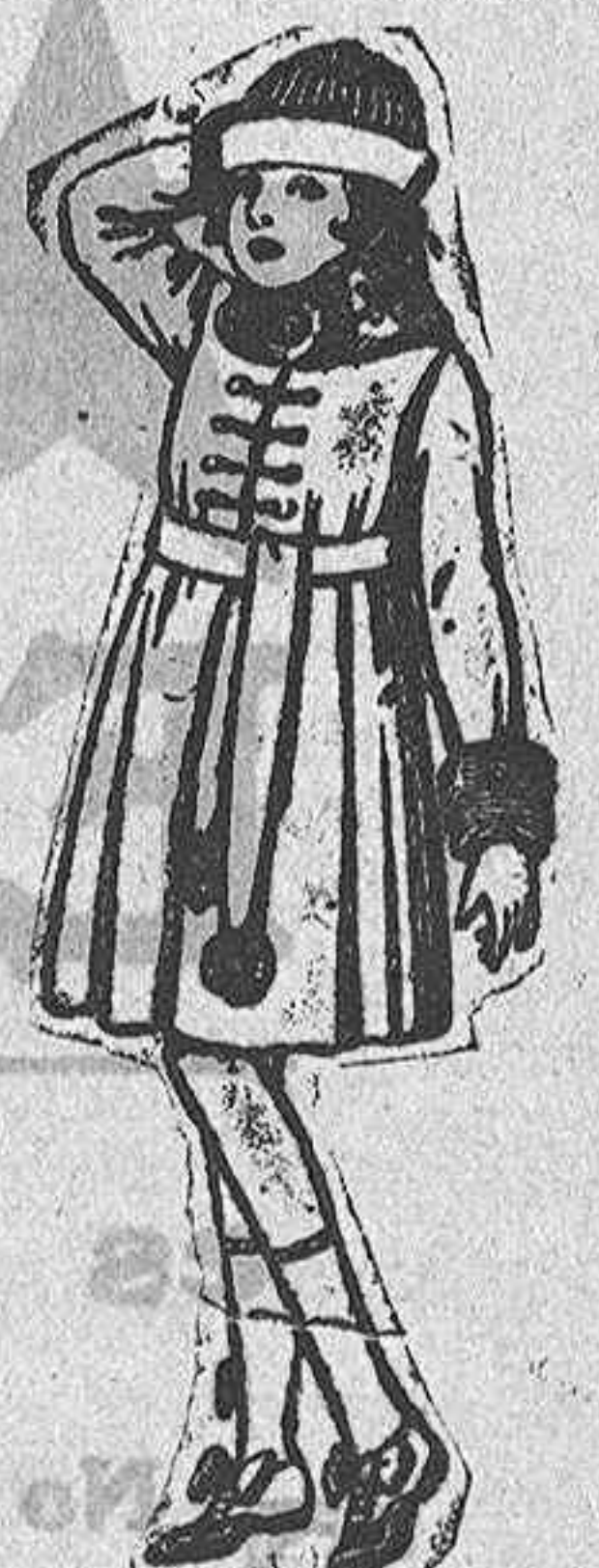
Abrigos cheviot, pañete, etc., color cuello y bocan gas piel, para ni- ñas de 7 a 15 años De ptas. 46 a 49.