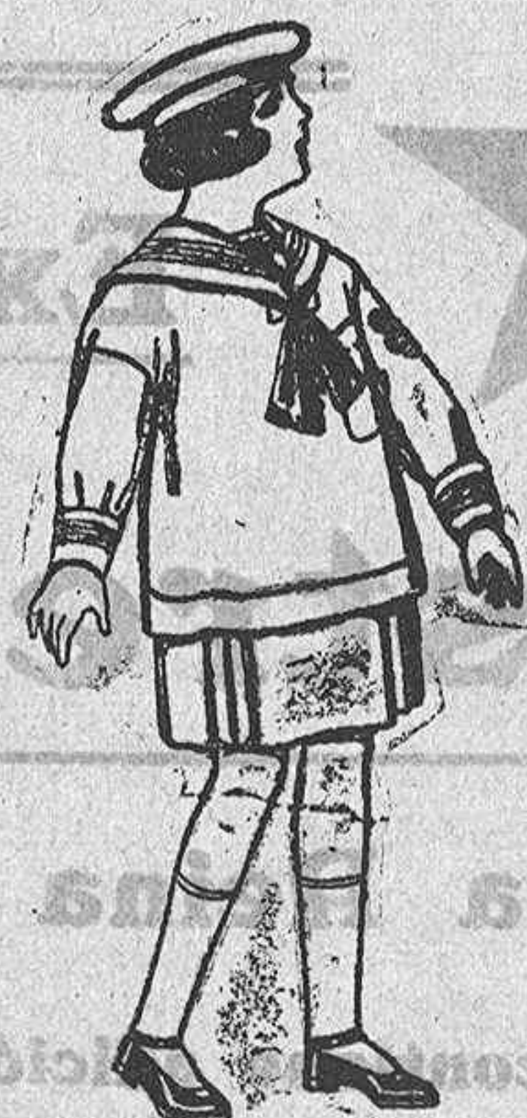
Trajes de marinera de sarga inglesa para ni- ños de 4 a 6 años. De ptas. 35 a 43.