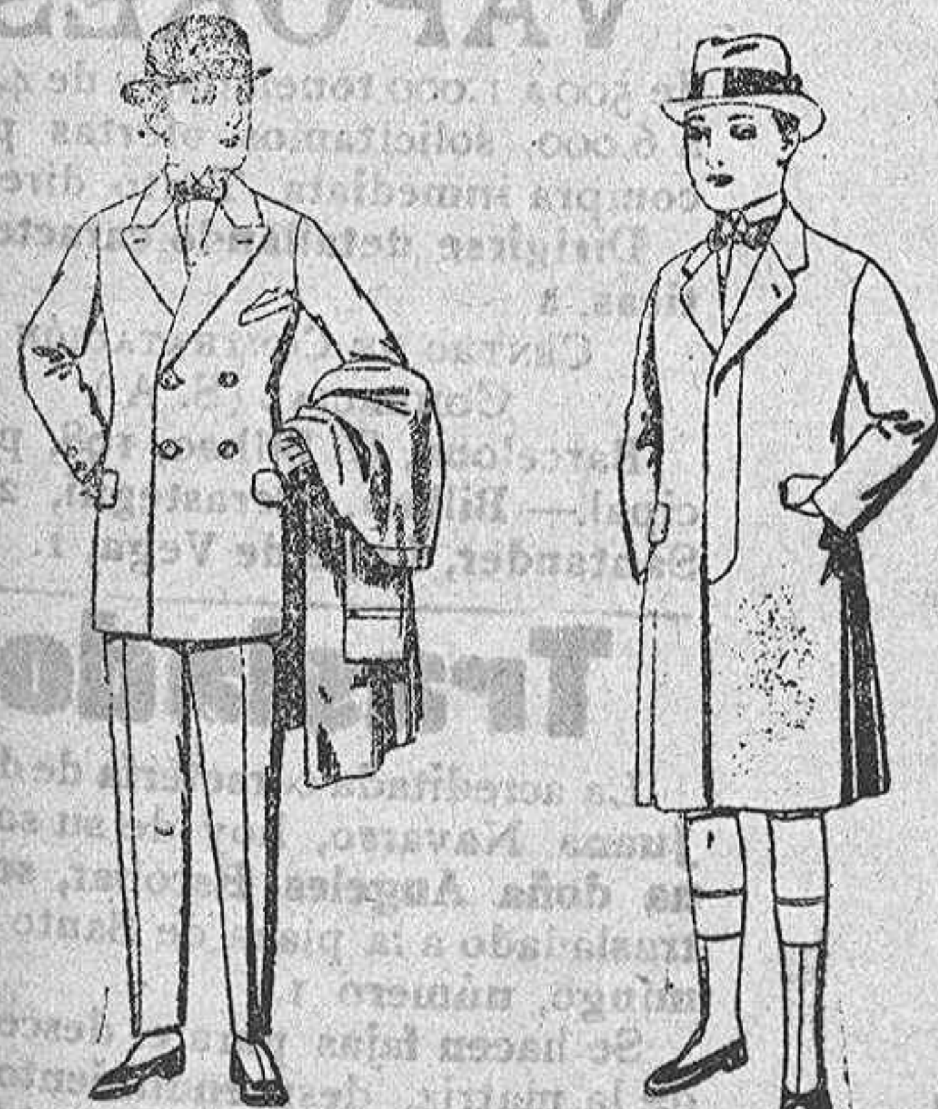
Trajes cheviot, mel- tón, etc., para joven- citos de 10 a 16 años. De ptas. 25 a 60.