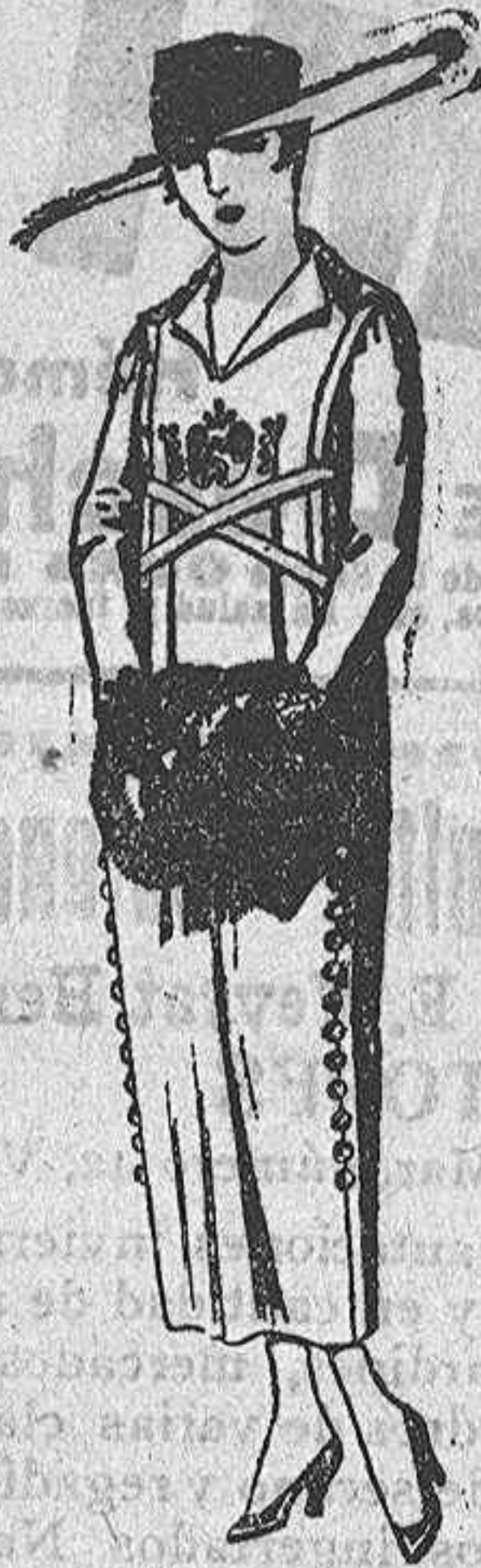
Vestidos de sarga inglesa en negro, azul y color, bordados. De ptas. 75 a 85.

Madrid, Barcelona, Alicante, Bilbao, Cádiz, Cartagena, Gijón, Granada, Málaga, Palma de Mallorca, Santander, Sevilla, Valencia, Valladolid, Zaragoza.