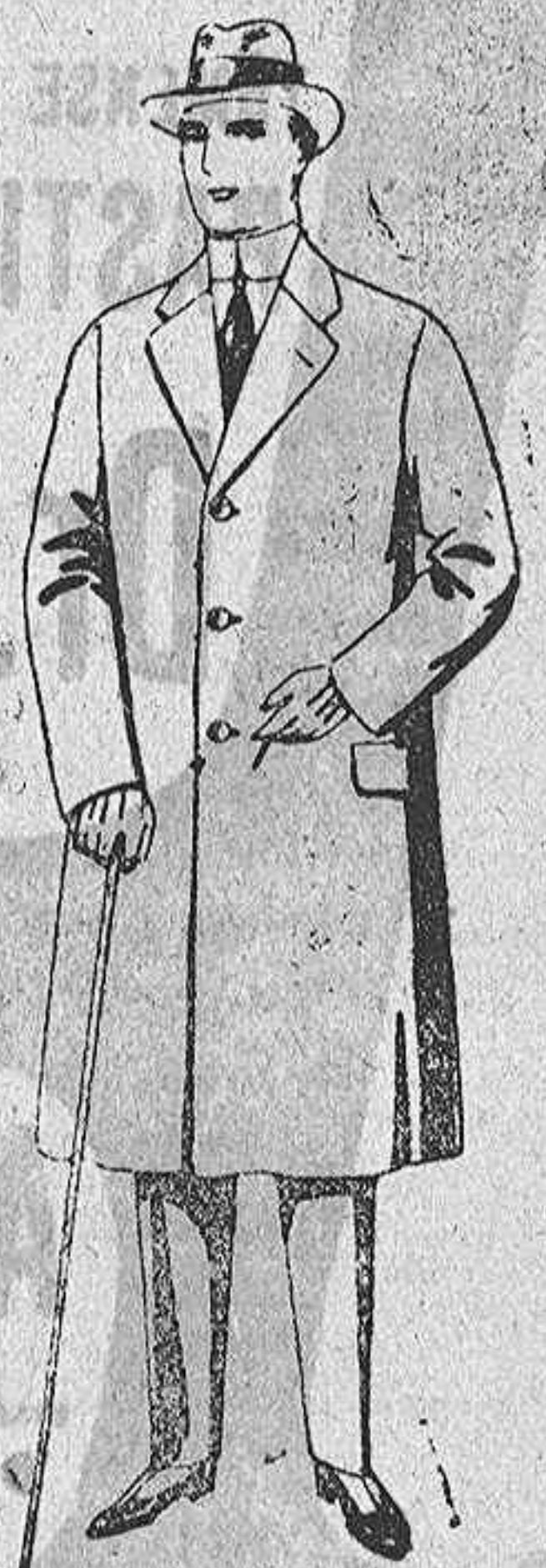
Gabanes de patén, meltón o cheviot, con forro de seda o satén; de ps. 47 a 112