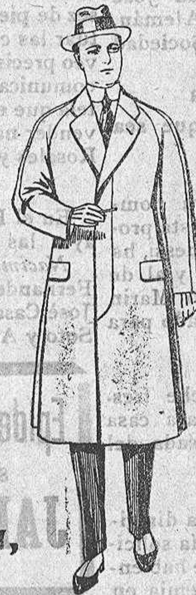
Gabanes de patén meltón o cheviot, con forro de seda o satén; de ps. 65 a 115