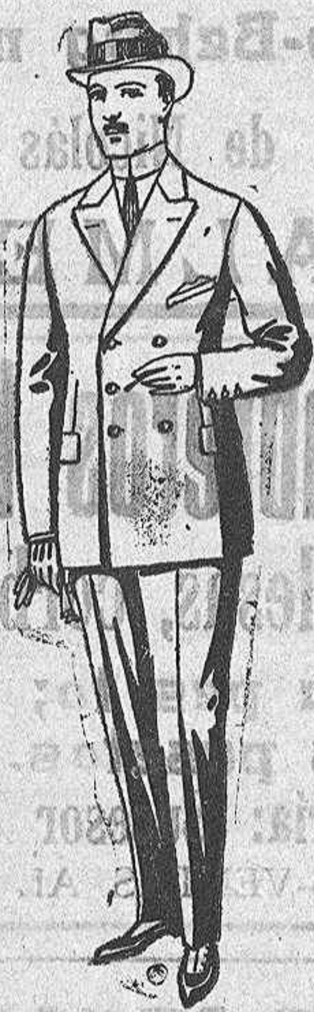
Trajes de cheviot meltón, etc. de ptas. 23 a 95.