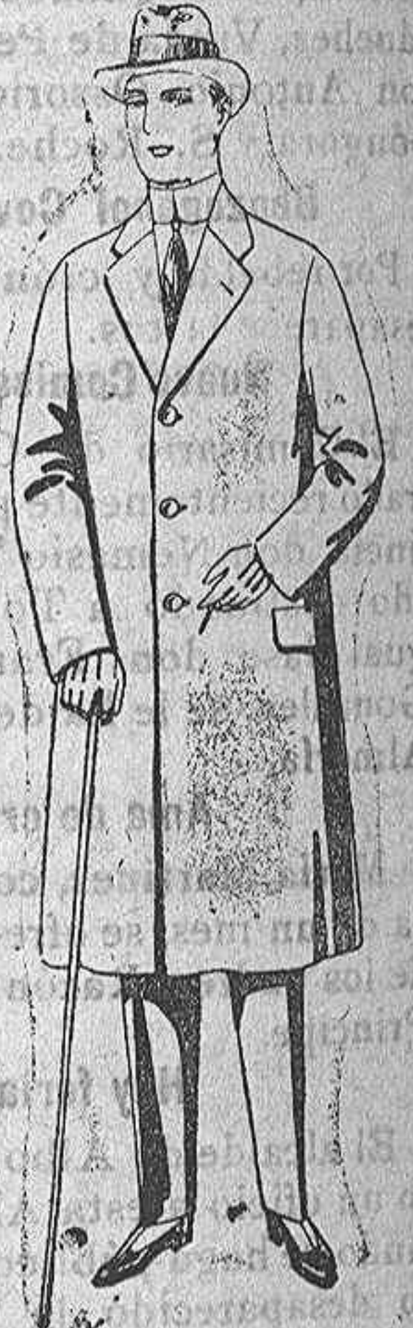
Gabanes de patén meltón o cheviot, con forro de seda o satén; de ps. 47 a 112