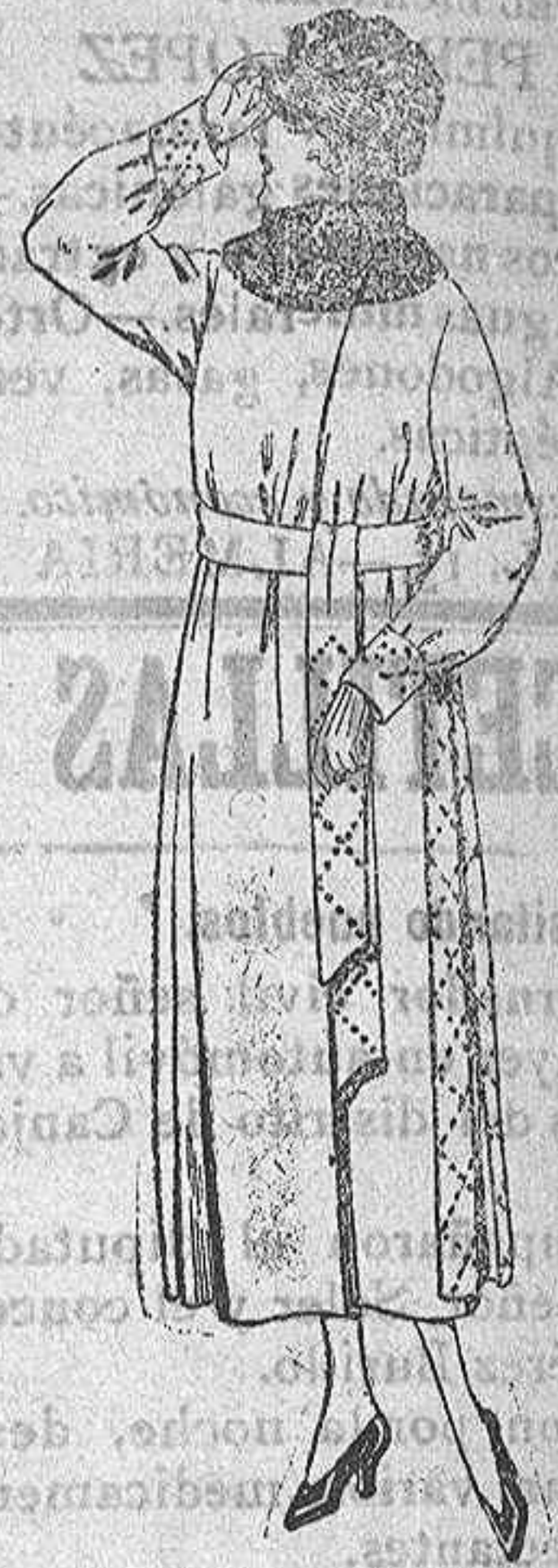
Abrigos de pañete gamuza, etc. en negro, azul y color, cuello piel. De ptas. 100 a 120