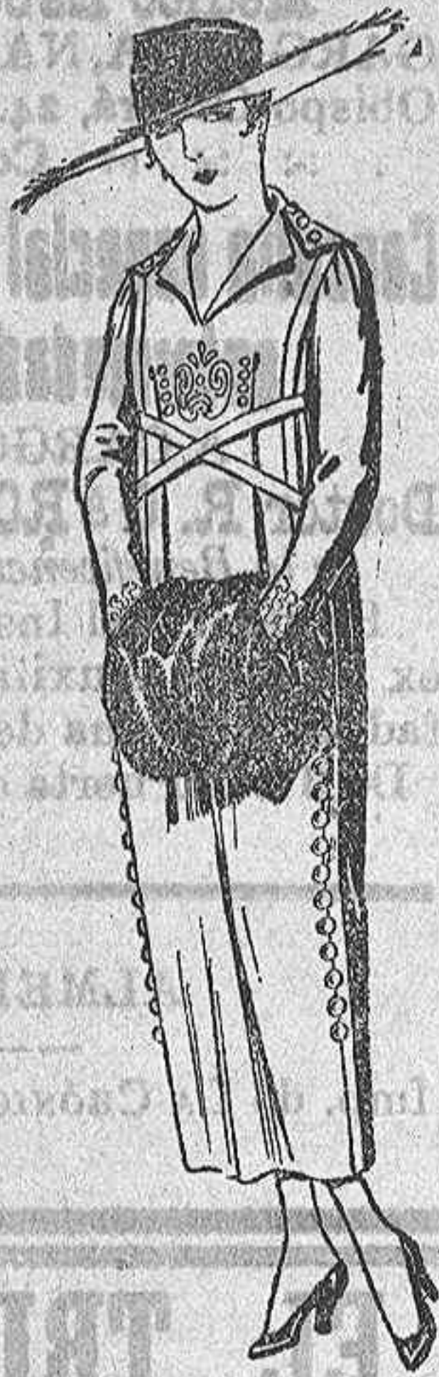
Vestidos de sarga inglesa en negro, azul y color, bordados. De ptas. 75 a 85

Madrid, Barcelona, Alicante, Bilbao, Cádiz, Cartagena, Gijón, Granada, Málaga, Palma de Mallorca, Santander, Sevilla, Valencia, Valladolid y Zaragoza.