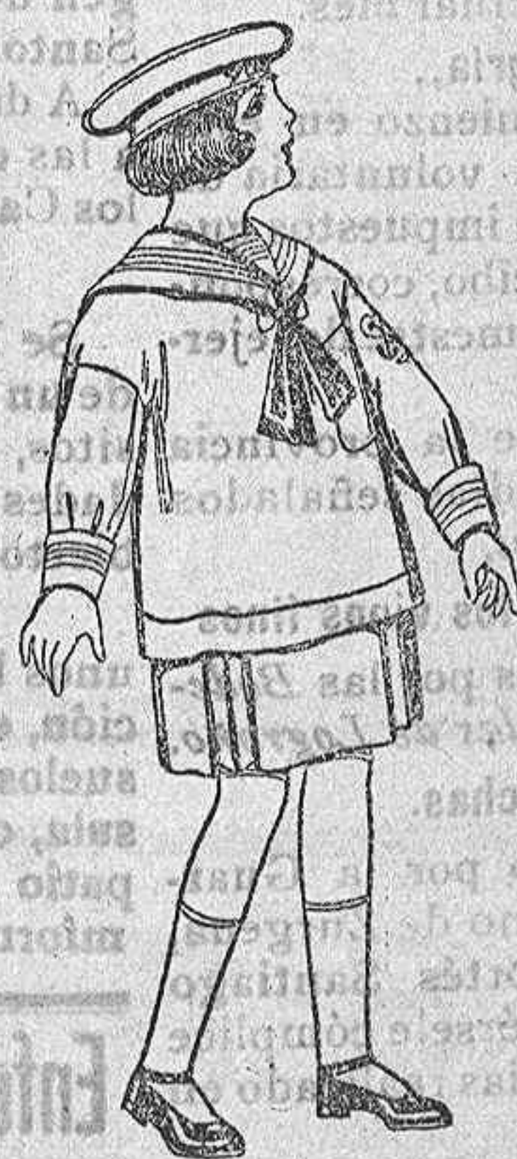
Trajes de marinera de sarga inglesa para ni- ñas de 4 a 9 años. De ptas. 35 a 43.