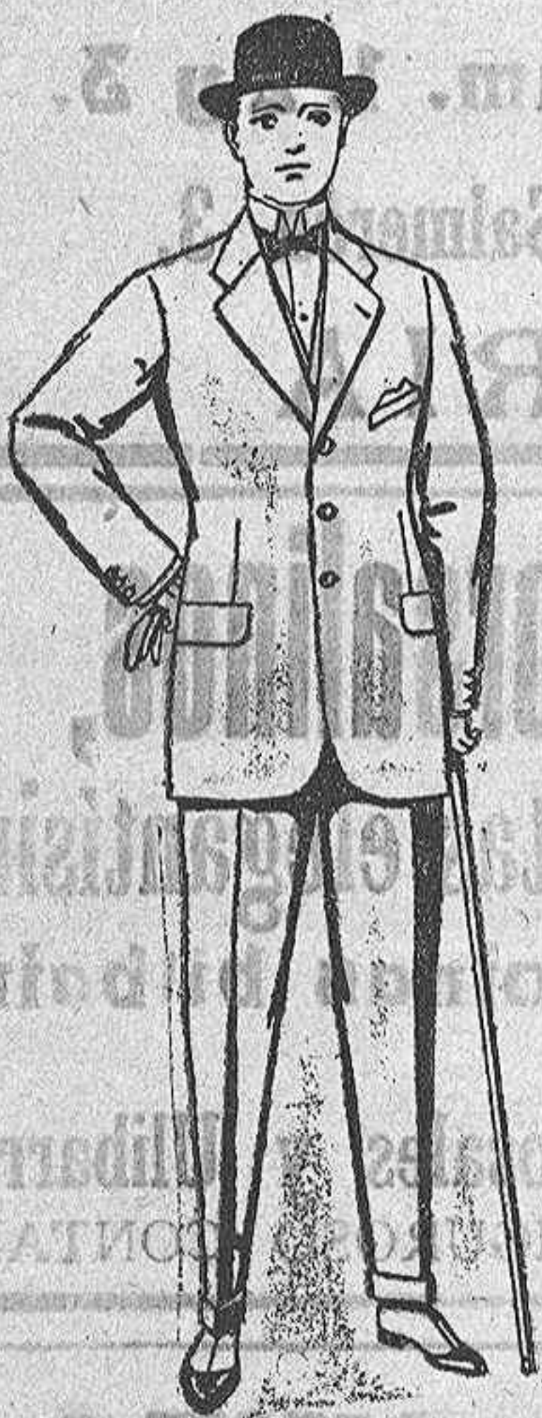
Trajes de cheviot, meltón, etc. De ptas. 28 a 95.