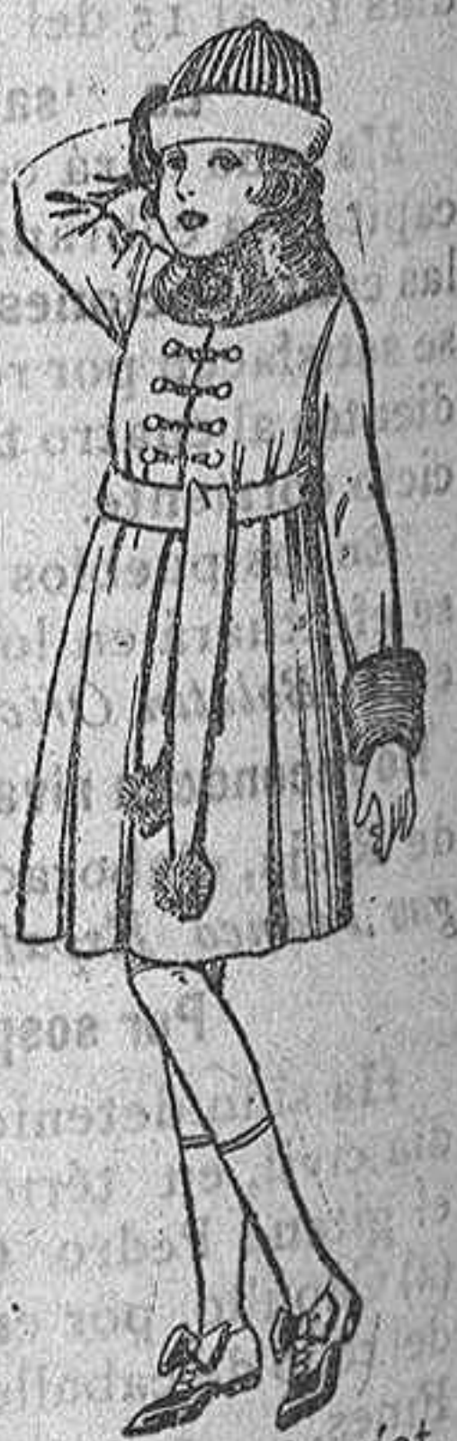
Abrigos cheviot, pañete, etc., color cuello y bocaman- gas piel, para ni- ñas de 7 a 15 años De ptas. 46 a 49.