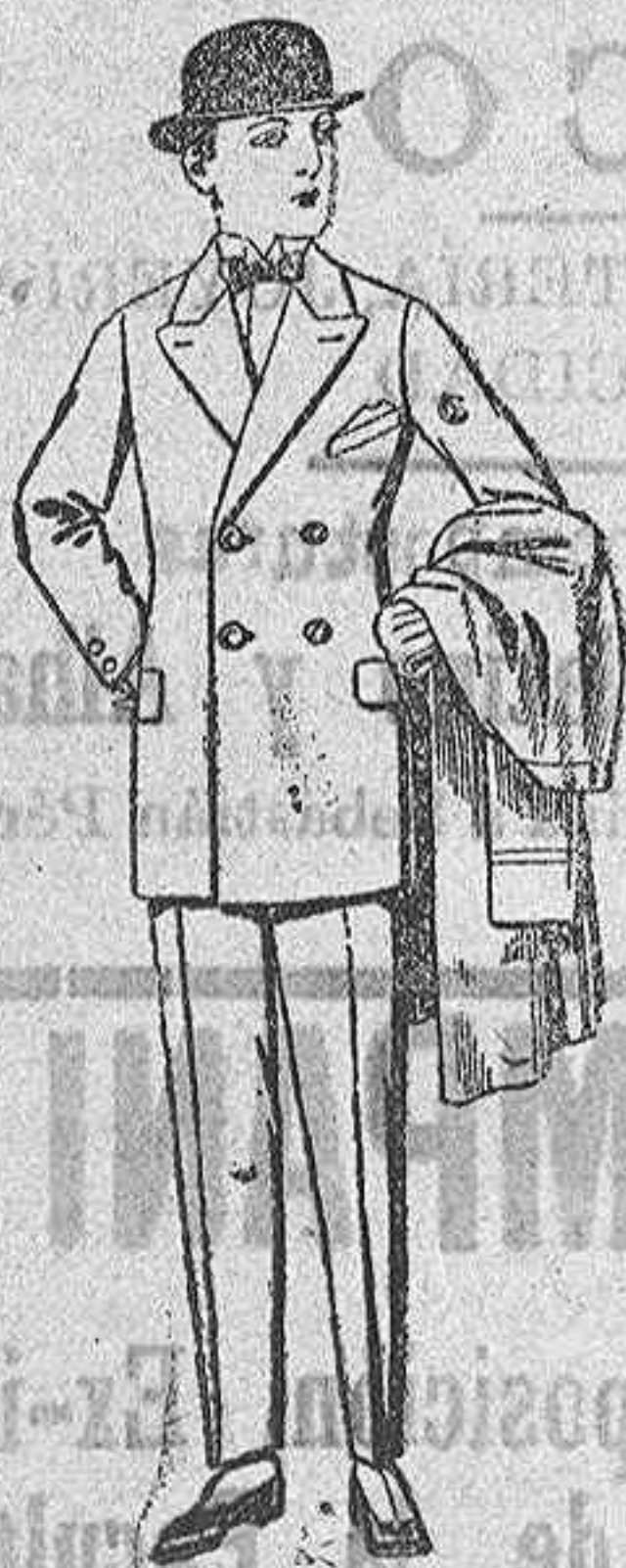
Trajes cheviot meltón, etc., para juven- citos de 10 a 16 años, de ptas. 25 a 60.