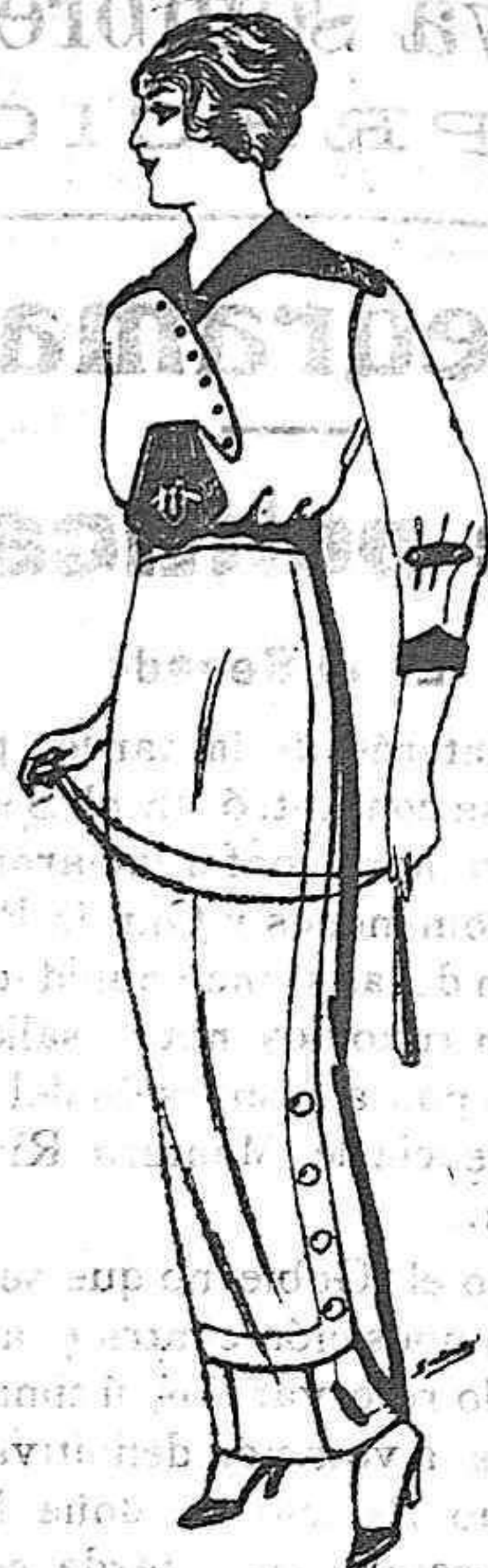
Blusa de seda blanca y colores, adornos borda- dos de Ptas. 25. Faldas de lana de ptas. 11 á 22

Agua Griega ¡Los calvos!—Los que han padecido enfermedades graves. Los que quieren conservar una cabellera larga, sedosa, exenta de imcreios y otros enemigos que amenacen su destrucción, deben usar AGUA GRIEGA, que es el mejor y más barato calvicida.—Precio el frasco, 2 pesetas