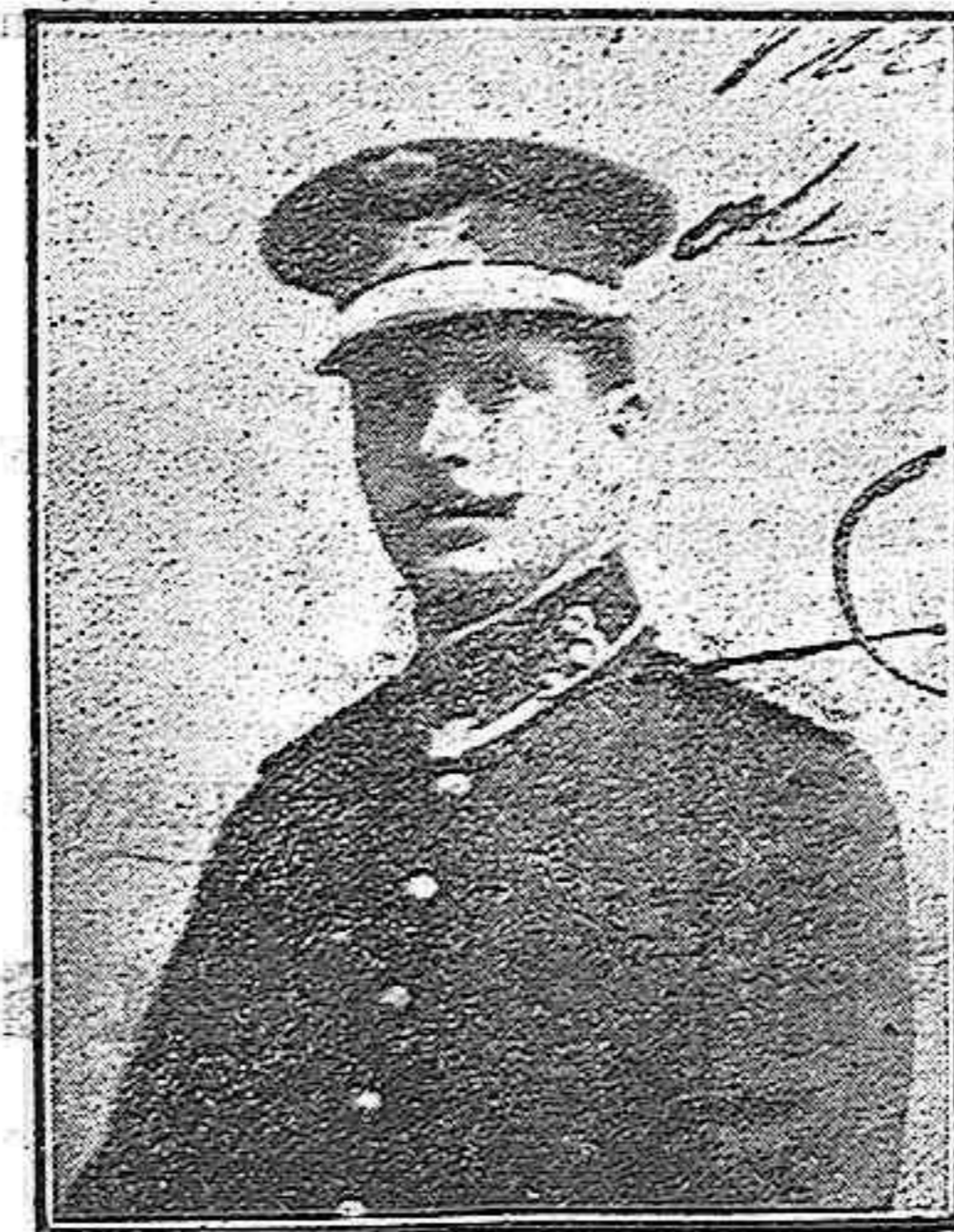
D. José García Nomdedeu

Siguiendo el curso de nuestra ilación de recordar á los que se distinguen en esta campaña, tan sangrienta como gloriosa para el Ejército que la sostiene, no debemos omitir el nombre de un querido amigo nuestro, el que con las muestras de valor é inteligencia dadas desde el comienzo de las operaciones de que nos ocupamos, enaltece una vez más al brillante Cuerpo á que pertenece; es éste el ilustrado capitán de Estado Mayor D. José Ma-