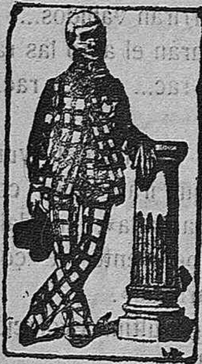
El presidente, M. MELONES