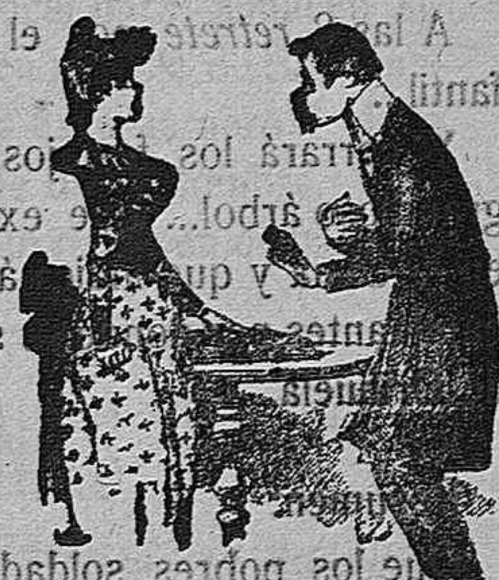
(Ella.—¿Usted no corre? Él.—No, por falta de facultades.

Cubrirán la carrera los del infantil (que empalago).