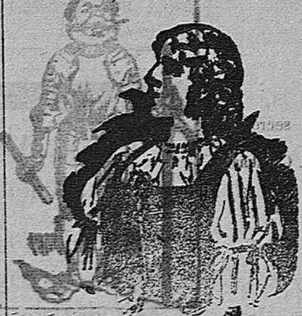
(Y nosotras, compuestas, y... hacer nono).