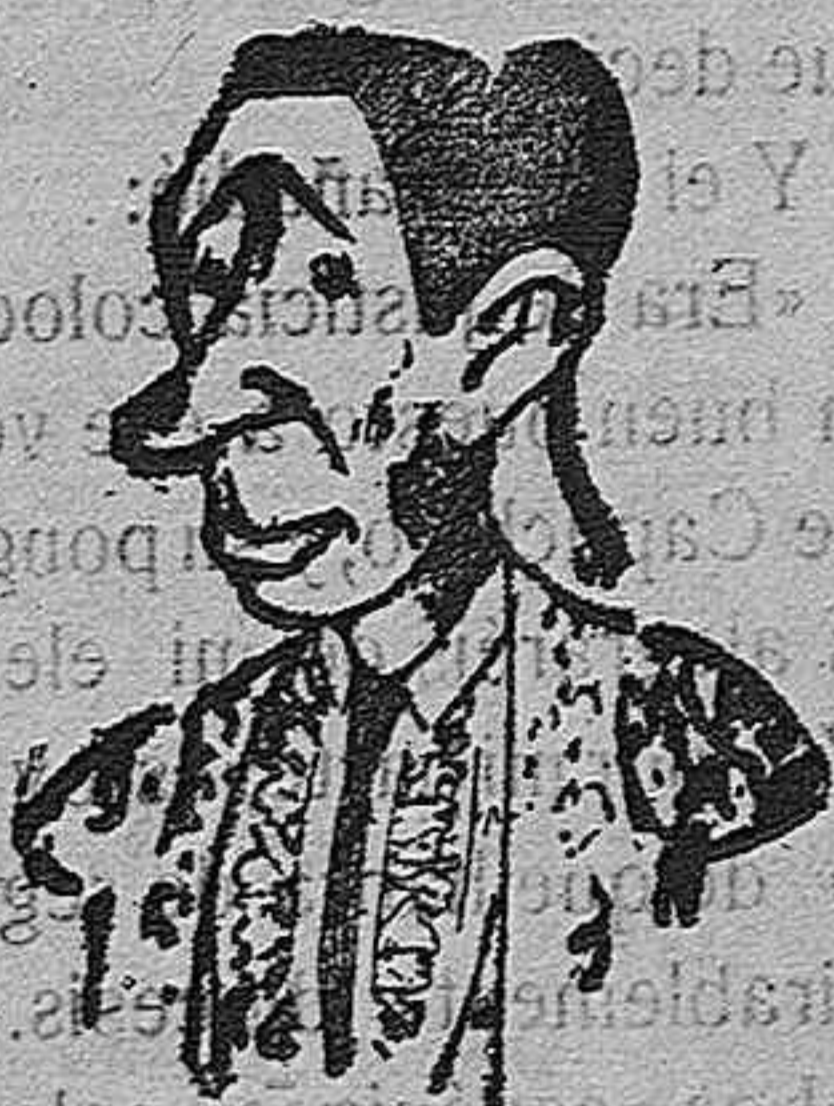
(Diestro que se ofreció para estas fiestas, seguro saldrá ileso de las corridas).

Una vez terminado el acto seguirán la guardia en los veinticinco céntimos de la feria.