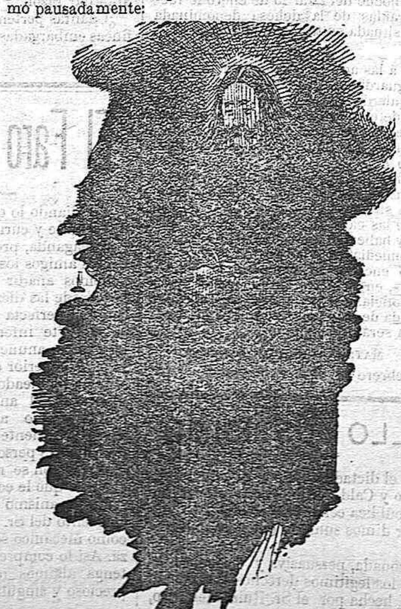
figura se ladeó inclinóse, fijó sus suaves miradas en el aturrido chico y con una voz tenue y fina que resonó en la alcoba como un arrullo, sin cólera en el acento pero con una tristeza grande en la entonación, exclamó pausadamente:

En uno de estos torriscoes advirtió una extraña claridad á la cabecera del lecho. El muro se bañaba de luz y la dulce imagen del Salvador, colgada en la pared crecía, crecía hasta tomar el tamaño natural, se hacía de bulto, se animaba y concluía por convertirse en el busto seráfico de un Jesús de carne y hueso. La dulce