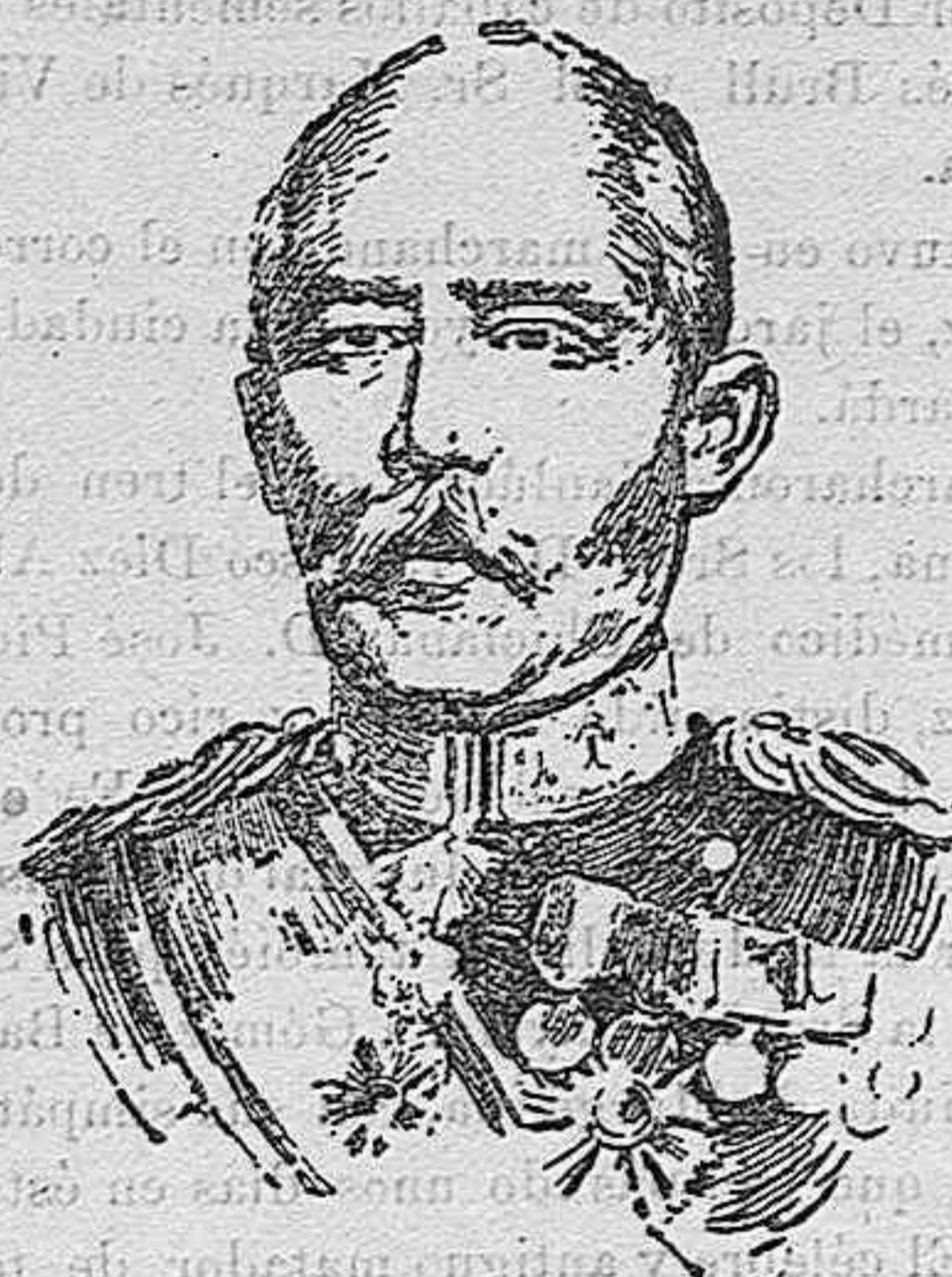
El general japonés Kuroki, vencedor de los rusos en el Yalu.