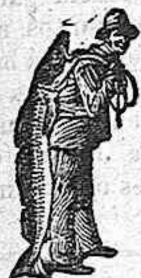
Obténase siempre la Emulsión con esta marca "El Pescador", marca del procedimiento Scott.

Quintanillabon (Burgos) Septiembre 20 1906.