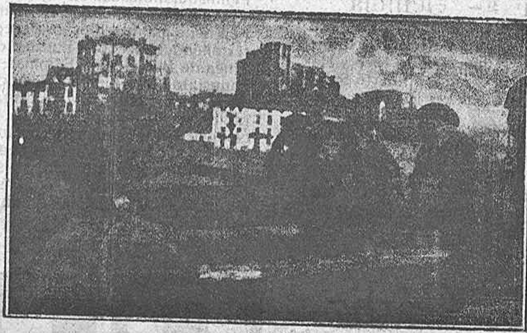
Marineros de Castro-Urdiales