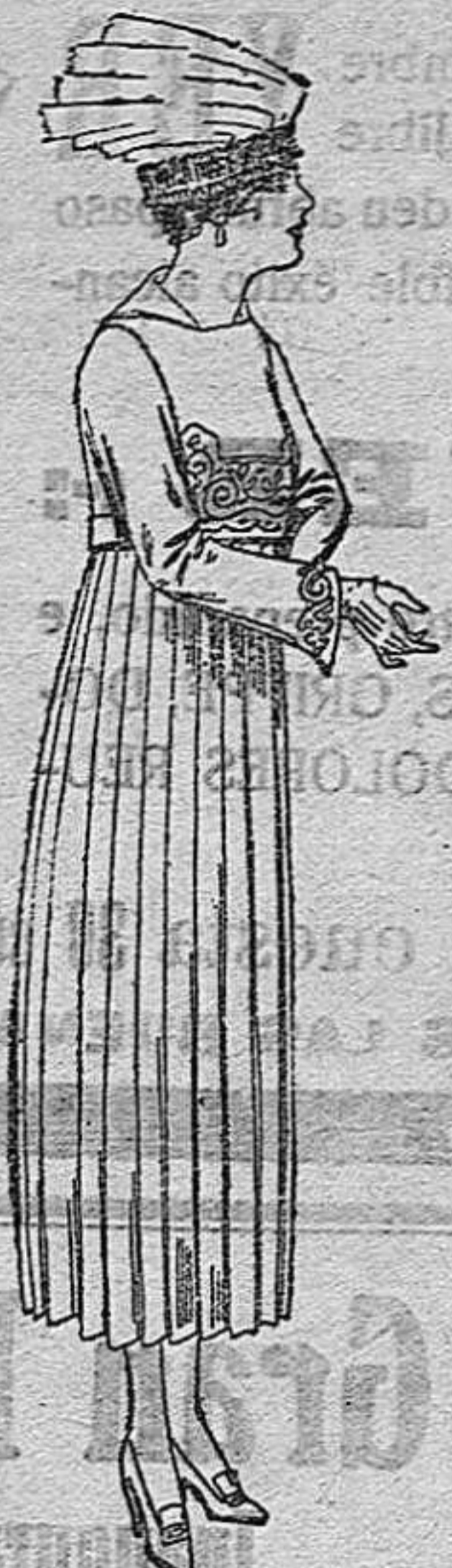
Vestidos de sarga inglesa, estambre, etc., en azul y color, bordados a mano. De pts. 75 a 85.