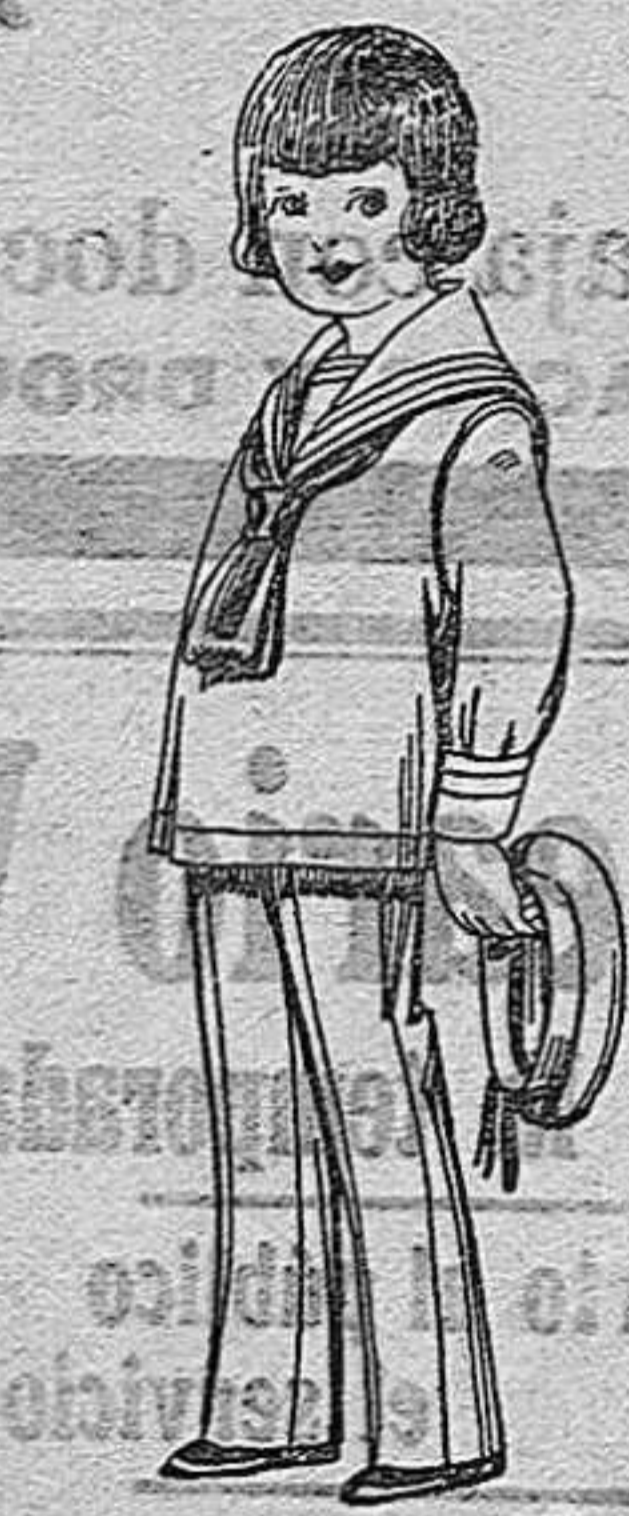
Trajes modelo "marinera Inglesa", de vicuña o estambre azul o negro para niños de 4 a 9 años. De pts. 26 a 34.

Precio fijo. Ventas al contado. ————— Pídate el Catálogo general