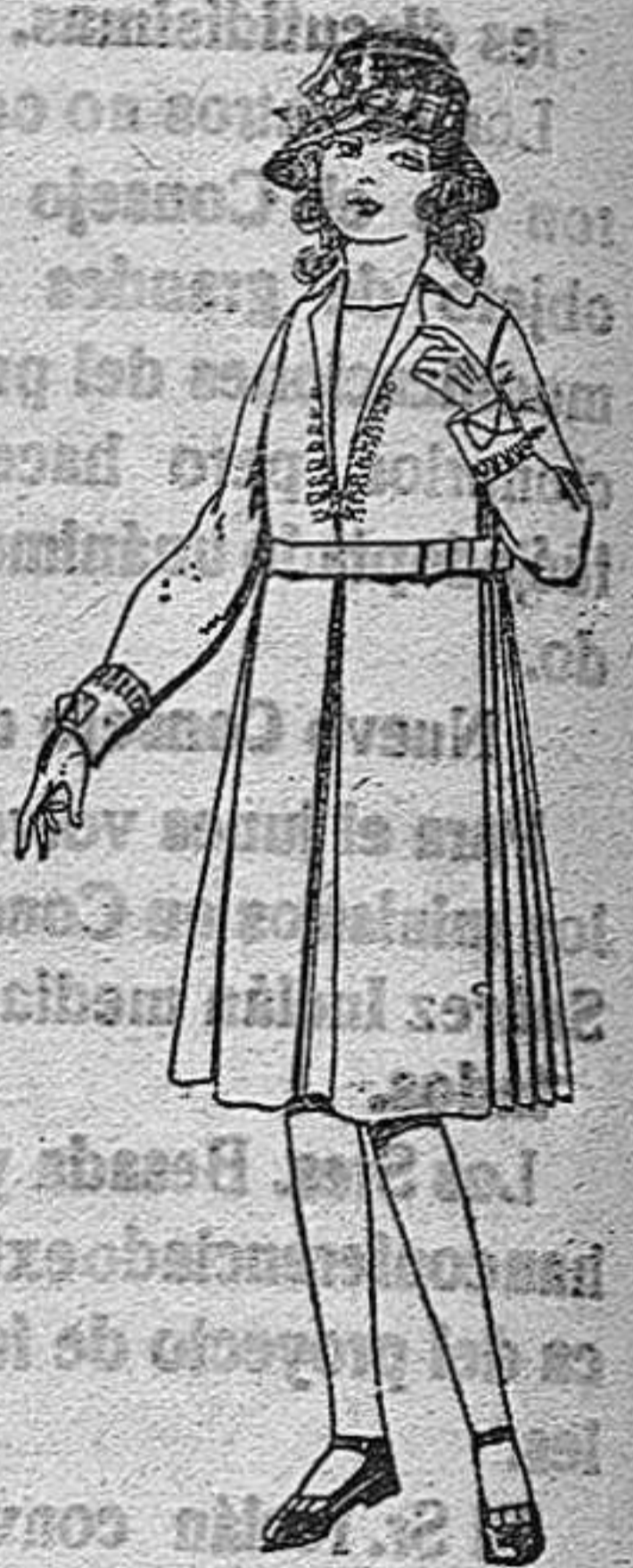
Vestidos de lanilla, estambre, etc., bordados, para niñas de 4 a 9 años. De pts. 34 a 42.