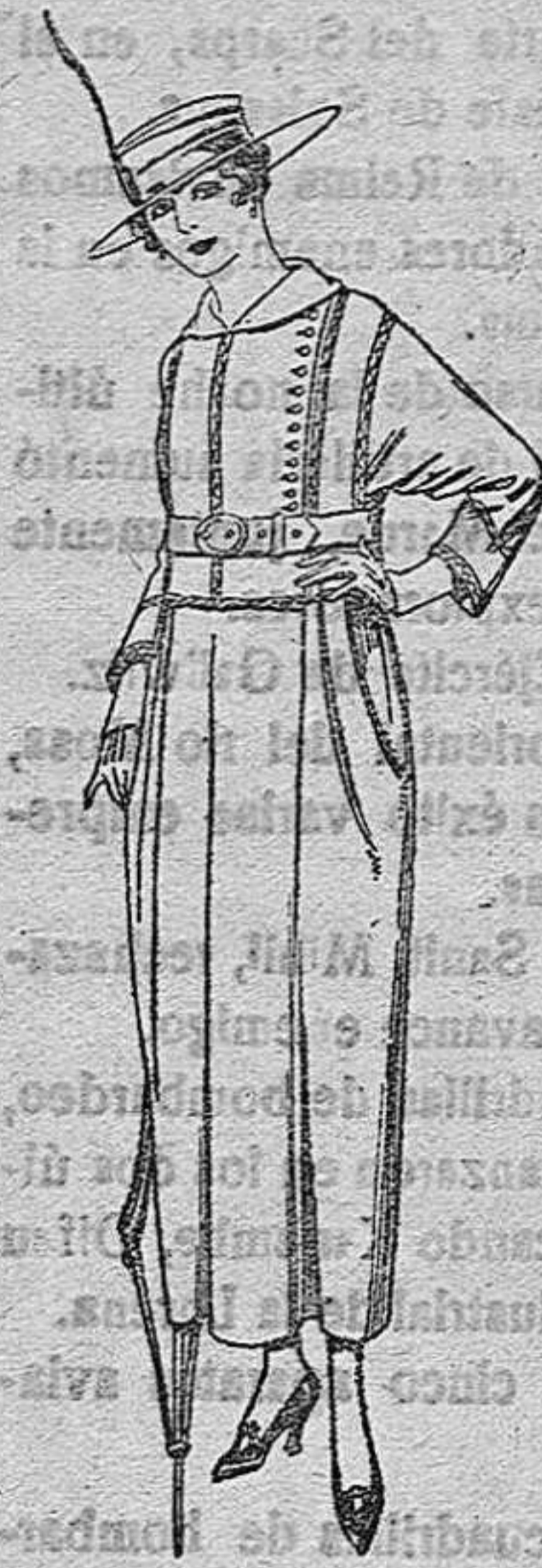
Vestidos de sarga inglesa, estambre, lanilla, etc., en negro, azul y color. De pts. 70 a 75.