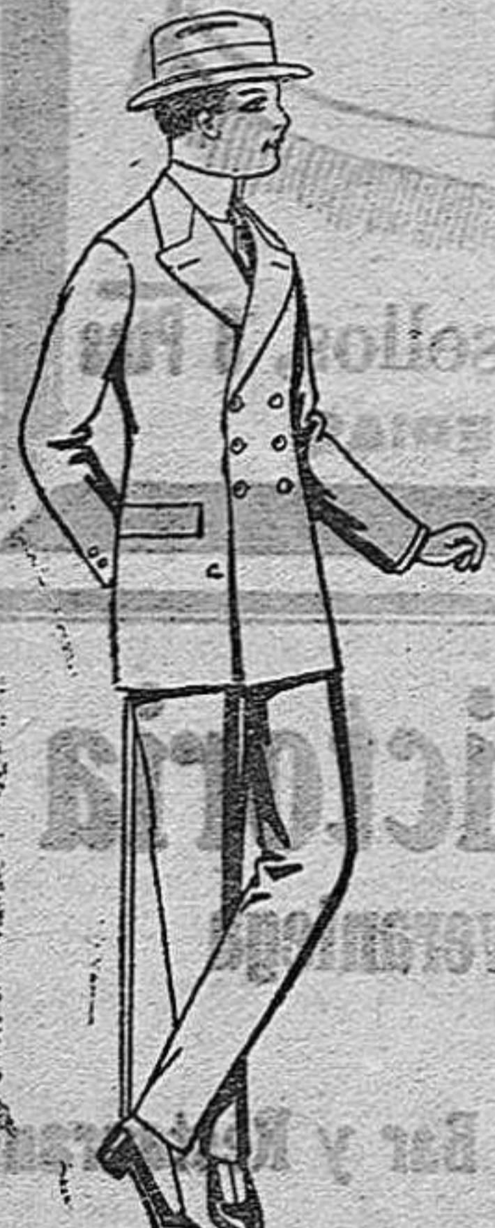
Trajes de lanilla, vicuña o estambre, para jovencitos de 10 a 12 años. De pts. 23 a 58.