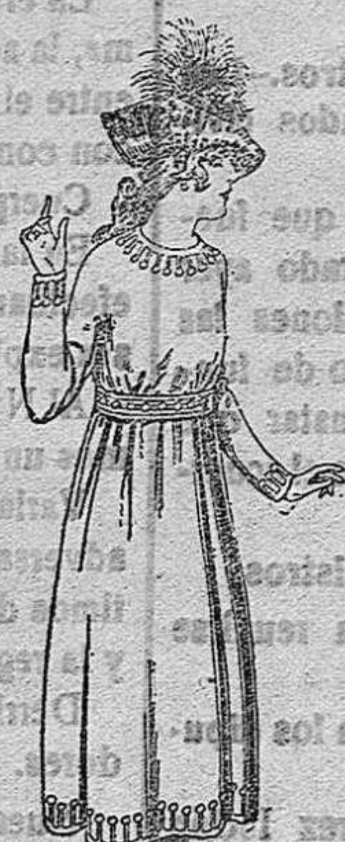
Vestidos de sarga inglesa, estambre, etc., en azul y negro, adornos bordados. De pts. 45 a 55.