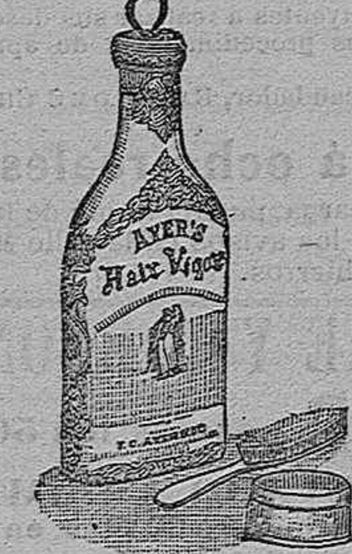
Preparado por el Dr. J. C. Ayer y Ca., Lowell, Mass., E. U. A.

Cura los humores acompañados de coque, conserva fresco, húmedo y sano el cráneo, impidiendo la formación de la caspa. El Vigor del Cabello del Dr. Ayer es un artículo elegante del tocador, el favorito de las señoras y los caballeros. Comunica al cabello, barba y bigotes la suavidad de la seda y una delicada y permanente fragancia.