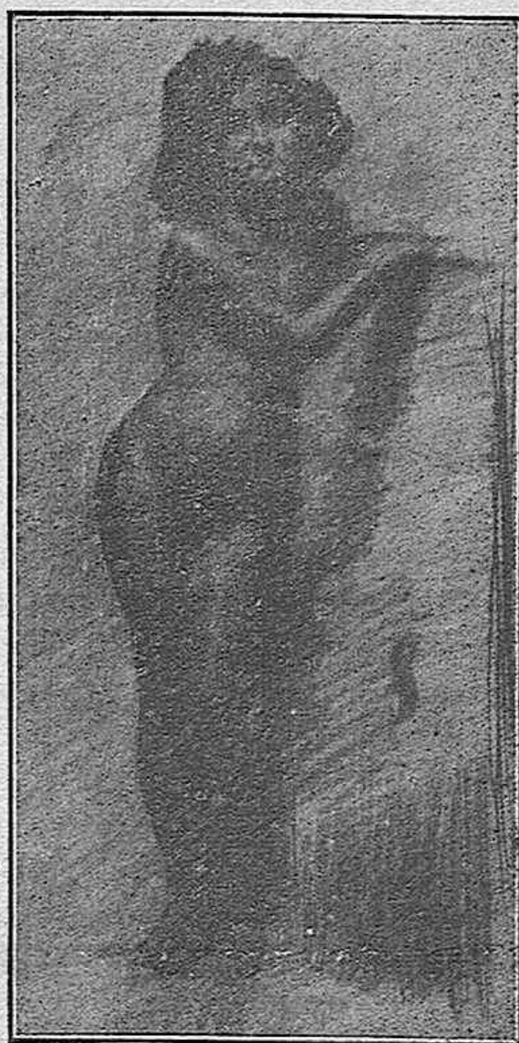
DESNUDO DE NIÑA Estudio por Francisco Patero.