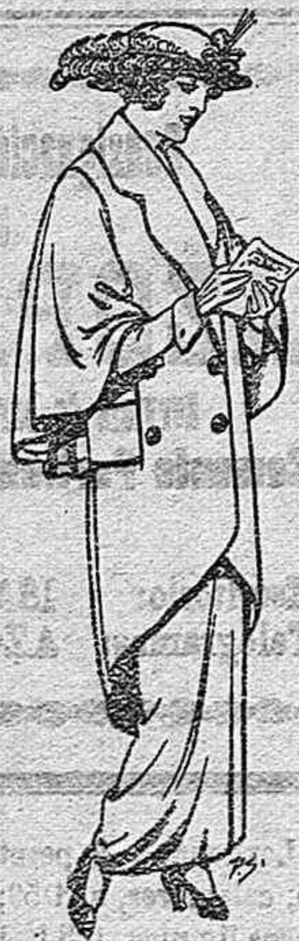
Abrigos de Paten para Señora. De Ptas. 55 a 65