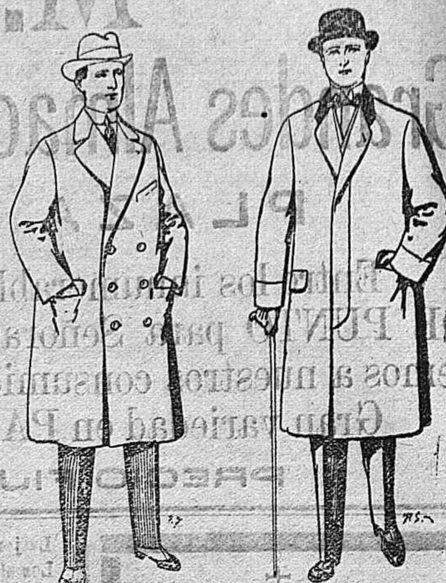
Gabanes de Paten y Cheviot. De Ptas. 55 a 105