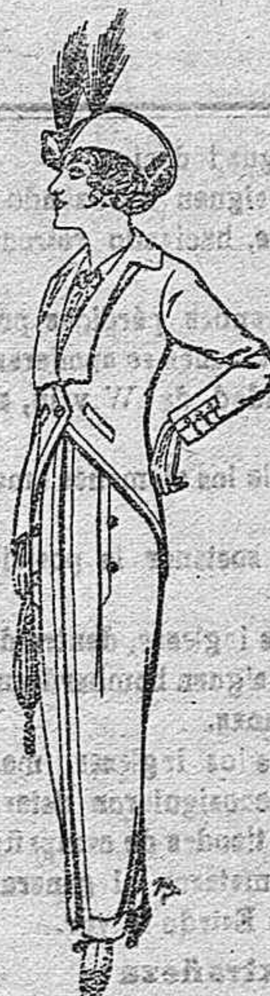
Trajes jerga negra para Señora. Ptas. 65