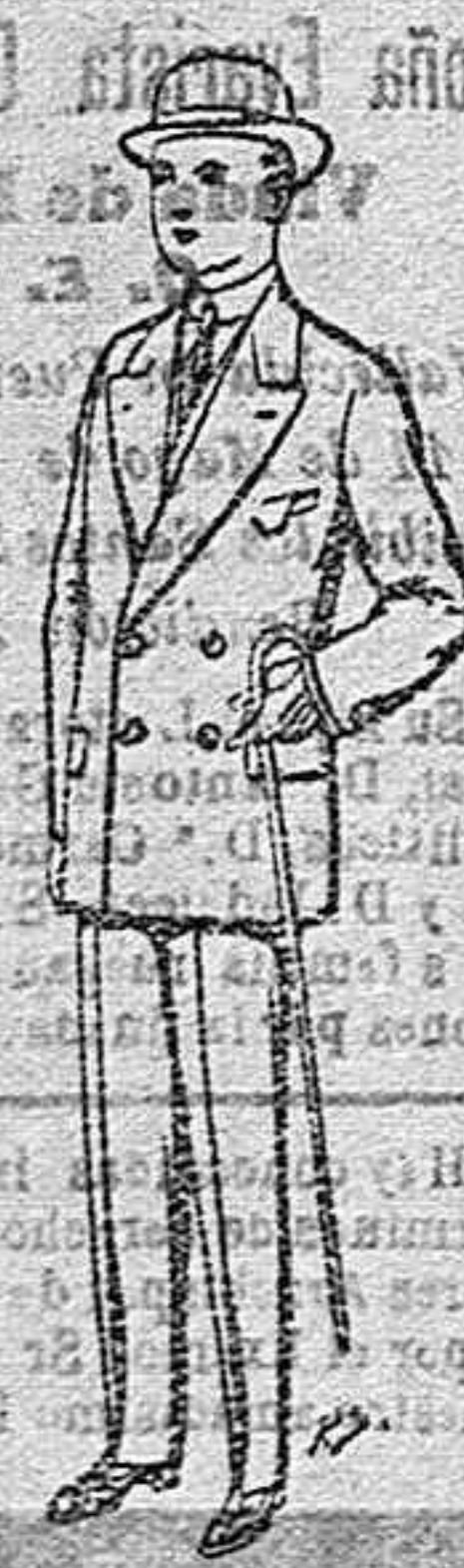
Trajes de Paten, Vicuña, etc. para niños de 10 a 16 años. De Ptas. 25 a 48