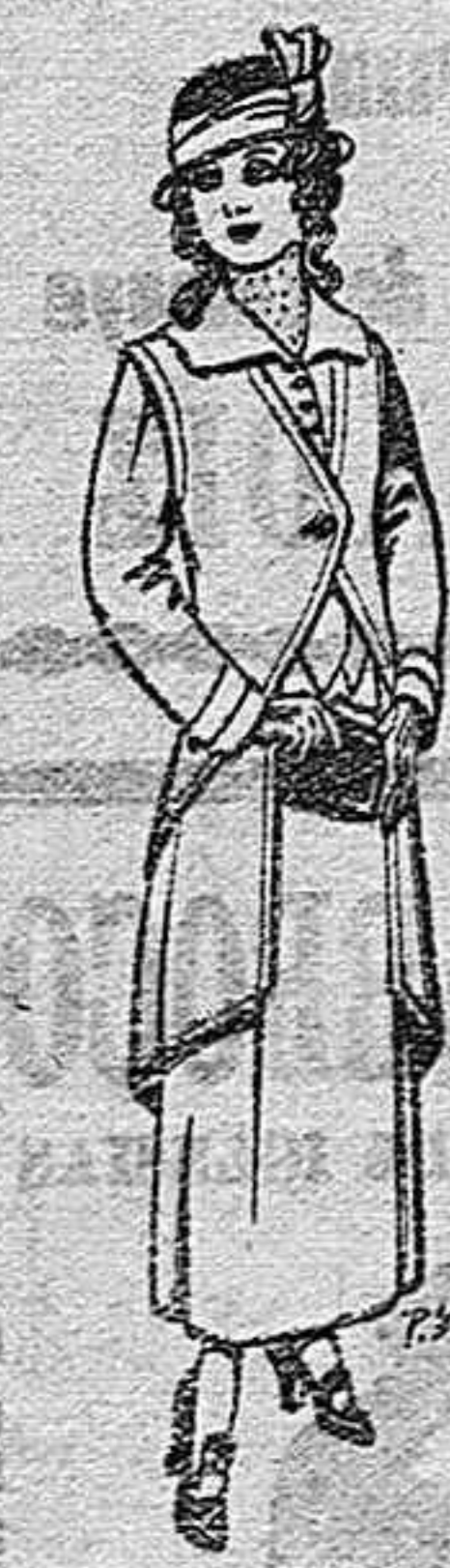
Trajes de lanilla para jovencitas de 13 a 16 años. De Ptas. 40 a 45.