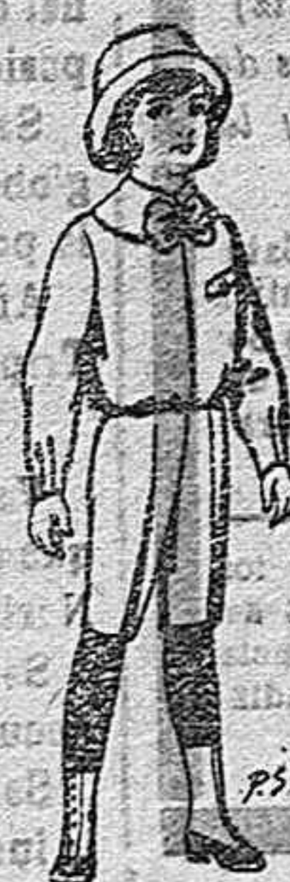
Trajes Paten para niños de 4 a 9 años. De Ptas. 5 a 5'50