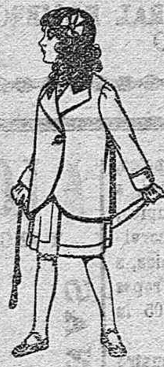
Trajes de lanilla, para niñas de 4 a 12 años. De Ptas. 14 a 22

PRECIO FIJO.-VENTAS AL CONTADO Pídase el Catálogo general