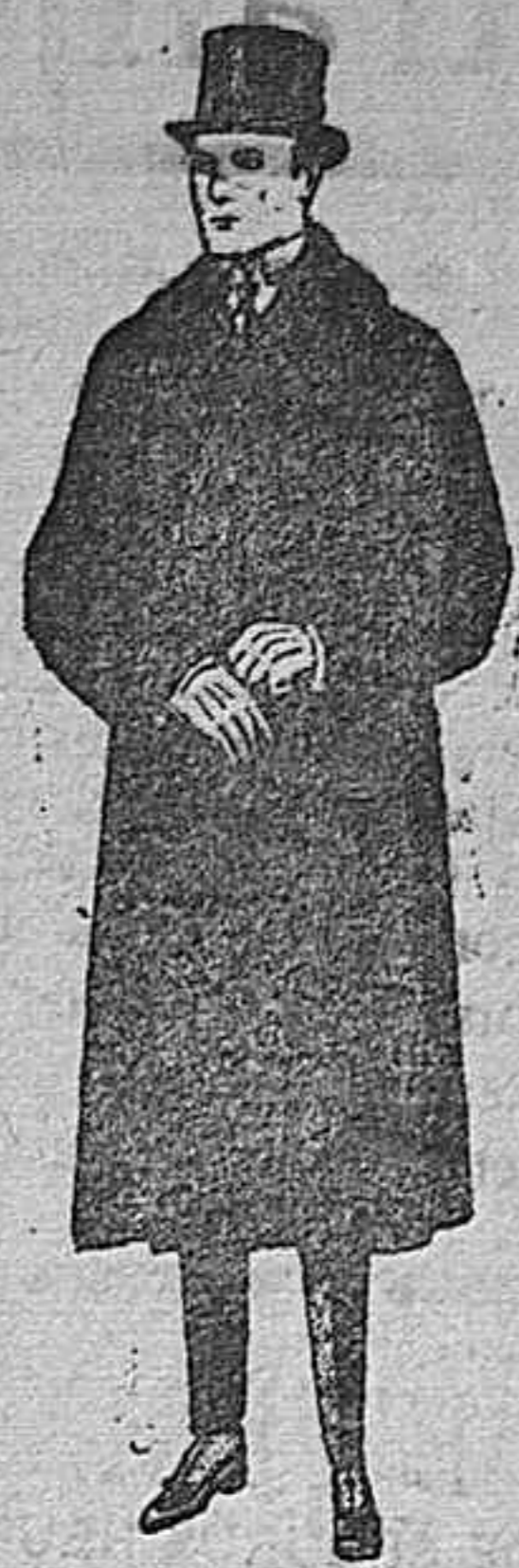
Gabanes de edredón negro, con cuello y vistas de piel. de ptas. 220 a 450