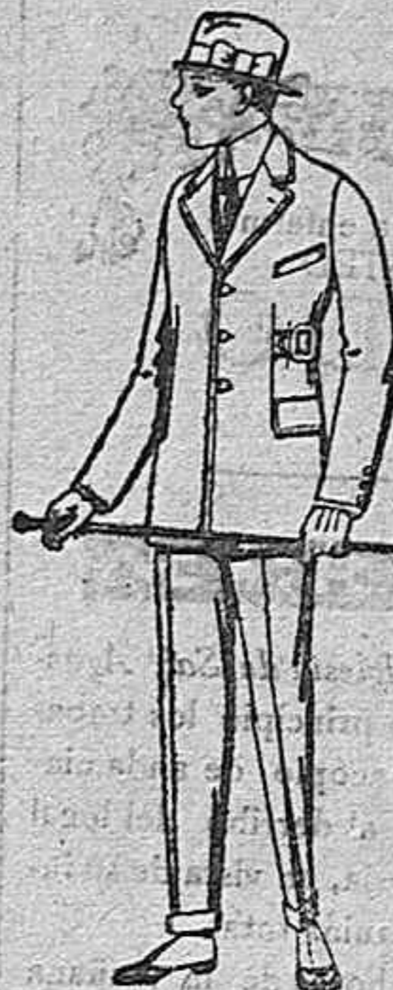
Trajes de patén, vicuña o jerga, etc, forma Sport, para niños de 10 a 12 años. de ptas. 45 a 83