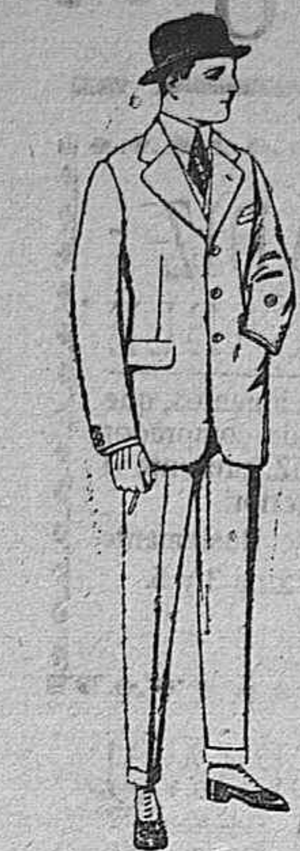
Trajes de cheviot, melton, vicuña o jerga. de ptas. 47 a 190

SUCURSALES: Madrid, Barcelona, Alicante, Almería, Bilbao, Cádiz, Cartagena, Gijón, Granada, Málaga, Palma de Mallorca, Santander, Sevilla, Valencia, Valladolid, Zaragoza.