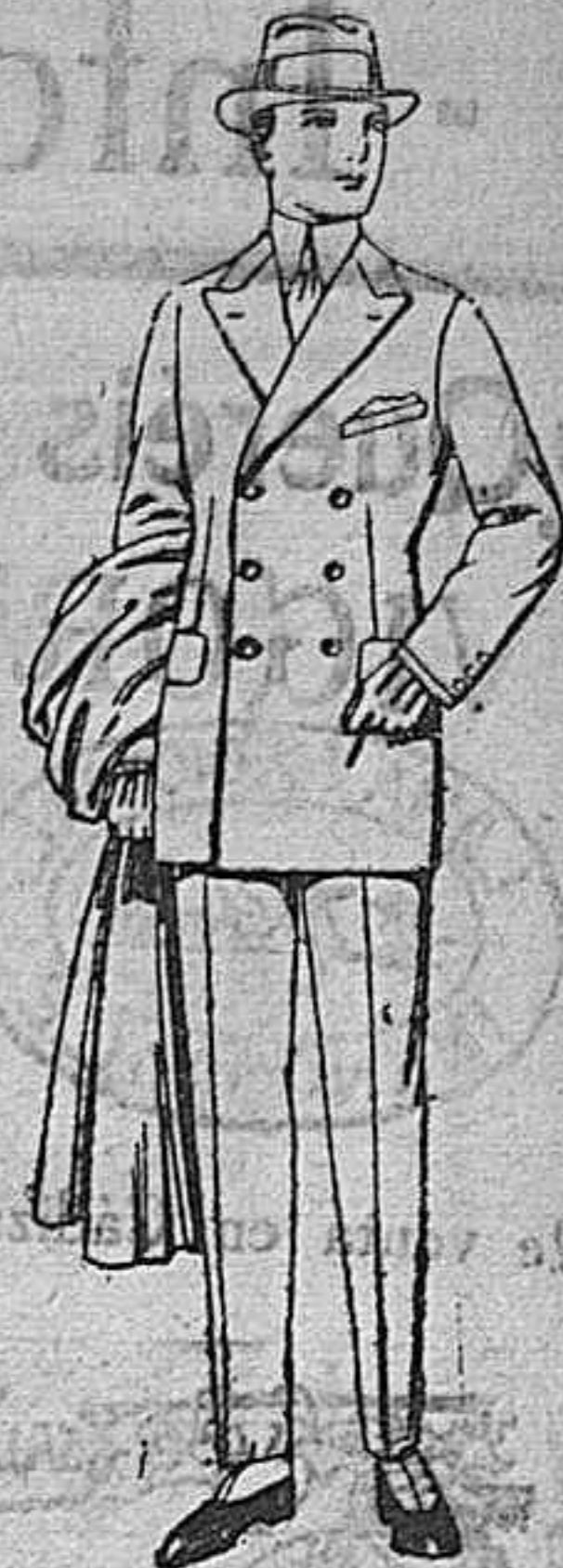
Trajes de cheviot, melton, vicuña o jerga. de ptas. 55 a 190