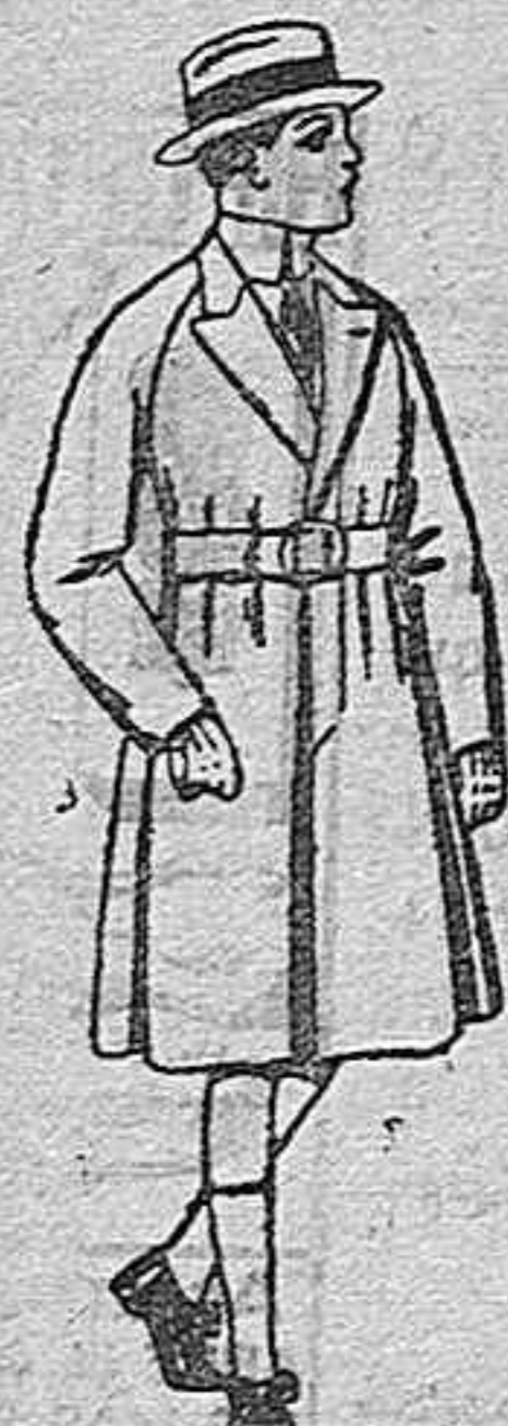
Gabanes de patén, para niños de 4 a 9 años. de ptas. 30 a 58