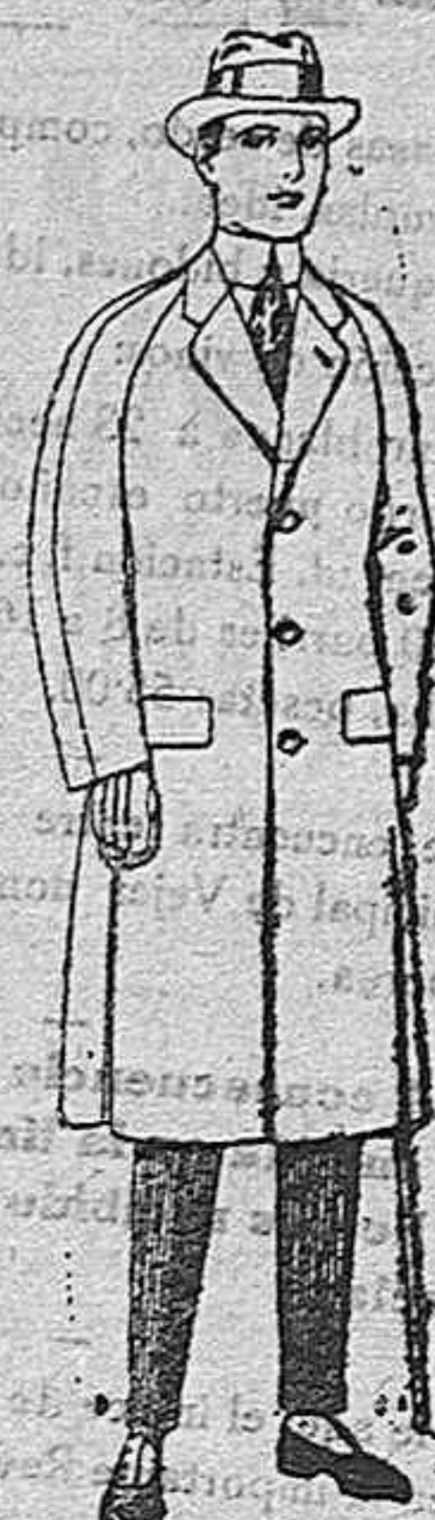
Gabanes de patén, melton, o cheviot, con forro de seda, sat, o escocés. de ptas. 68 a 185

ROPAS CONFECCIONADAS PARA CABALLERO, SEÑORA, NIÑO Y NIÑA Gorras, Sombreros, Cinturones, Calcetines, Paraguas, Corbatas, Pañuelos, Fajas, Ligas, Tirantes, etc., etc.