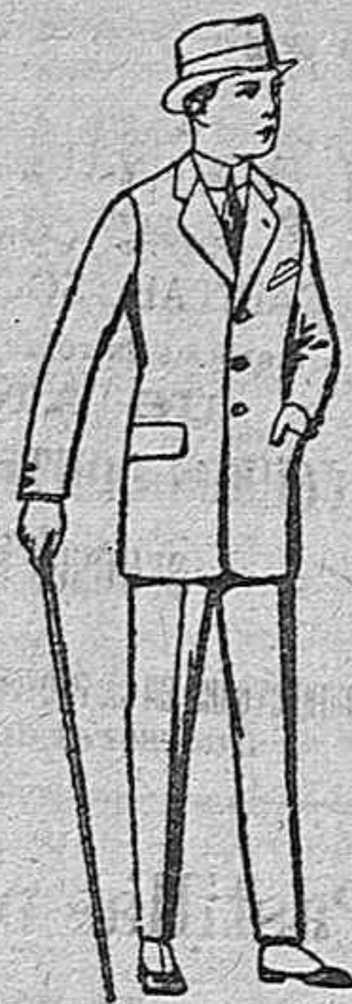
Trajes de patén, vicuña o jerga, para niños de 9 a 12 años. de ptas. 37 a 83