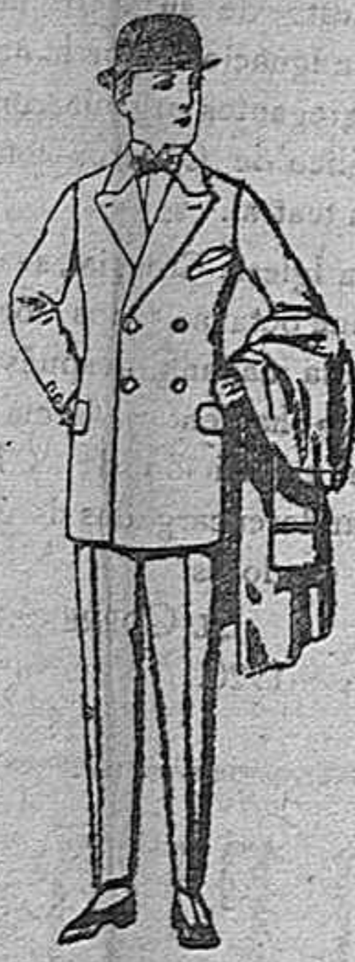
Trajes de patén, vicuña, etc, para niños de 10 a 12 años. de ptas. 39 a 83