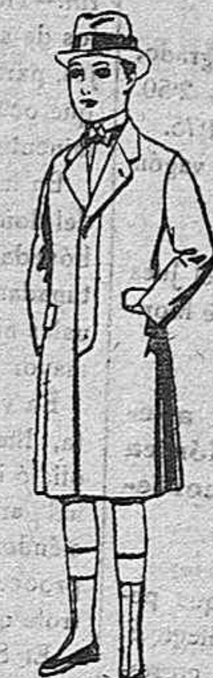
Gabanes de patén para niños de 10 a 12 años. de ptas. 35 a 62