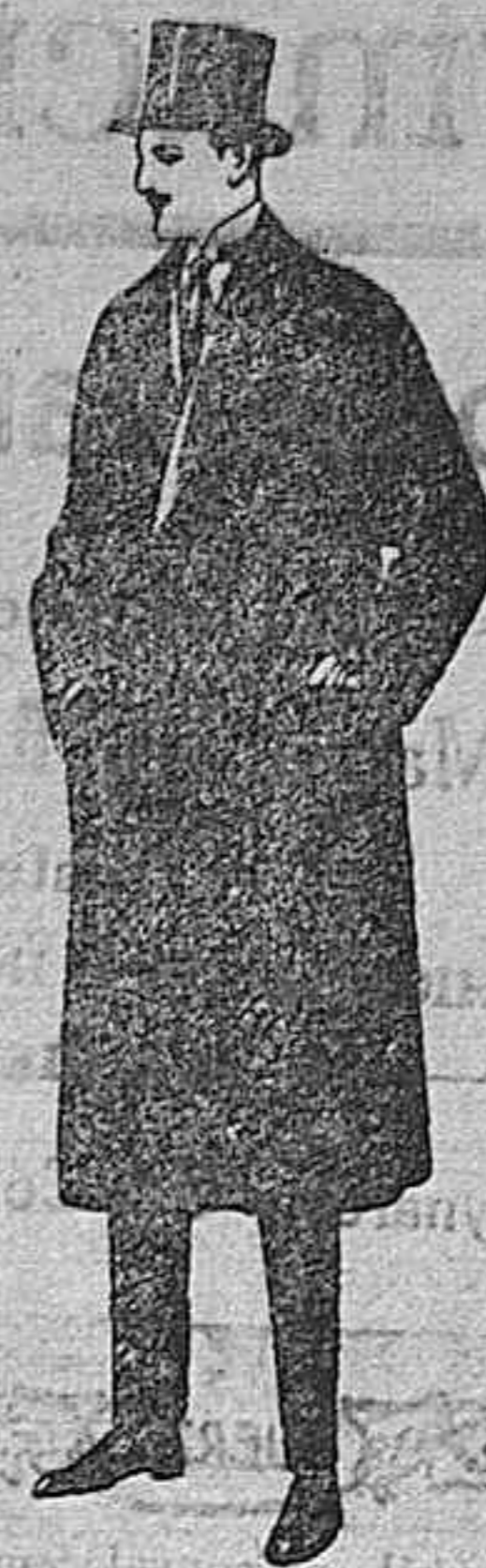
Gabanes de gamuza o vigonía, con vistas de seda. de ptas. 175 a 220