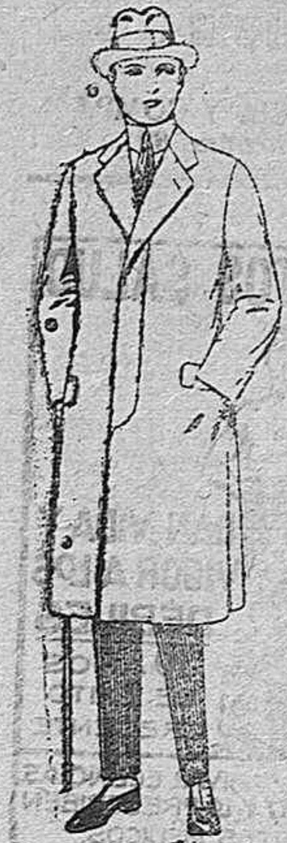
Gabanes de cheviot, gamuza, patén, etc. de ptas. 55 a 70