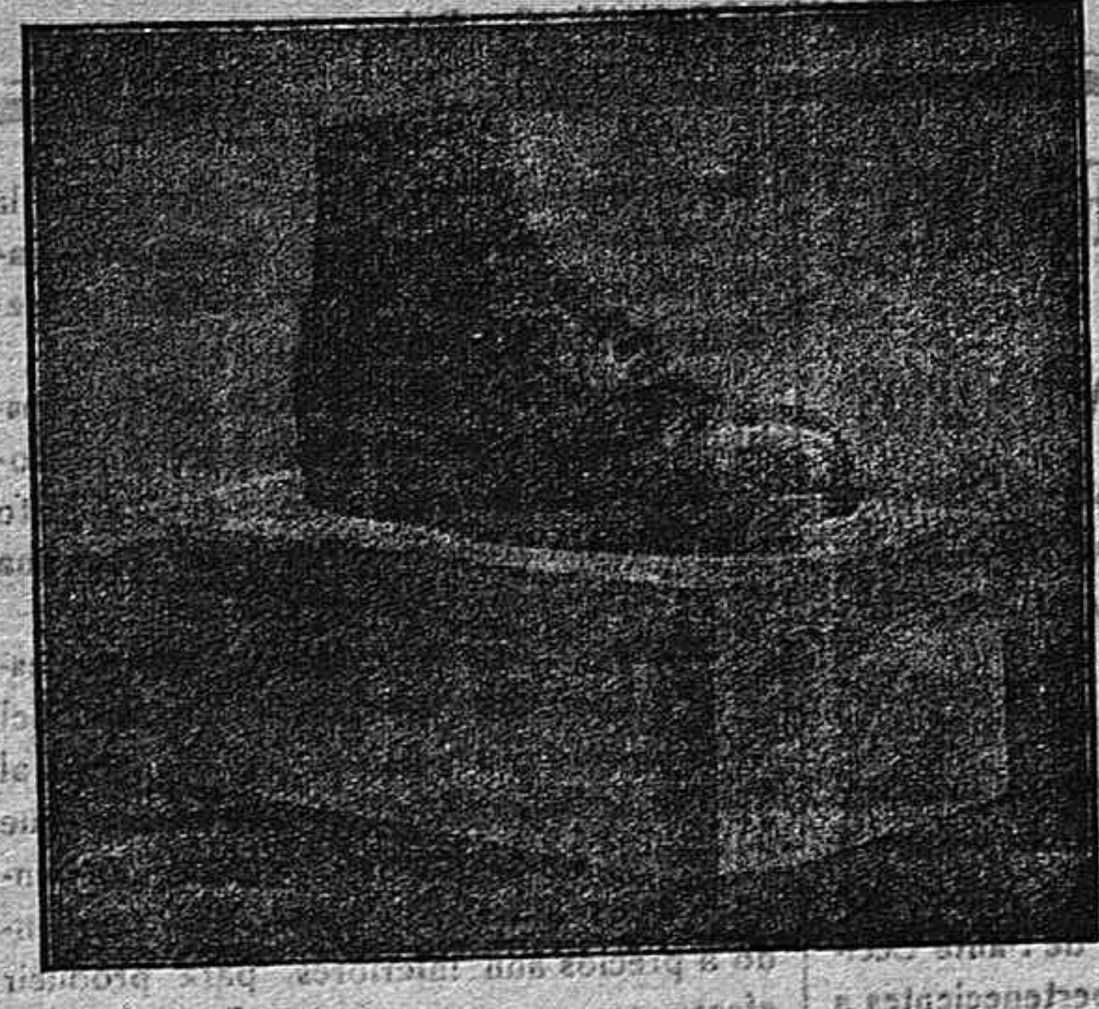
Sucursal n.º 4 San Francisco, 21 - Cádiz

Sucursal en Cádiz: Calle Ancha, número 14.