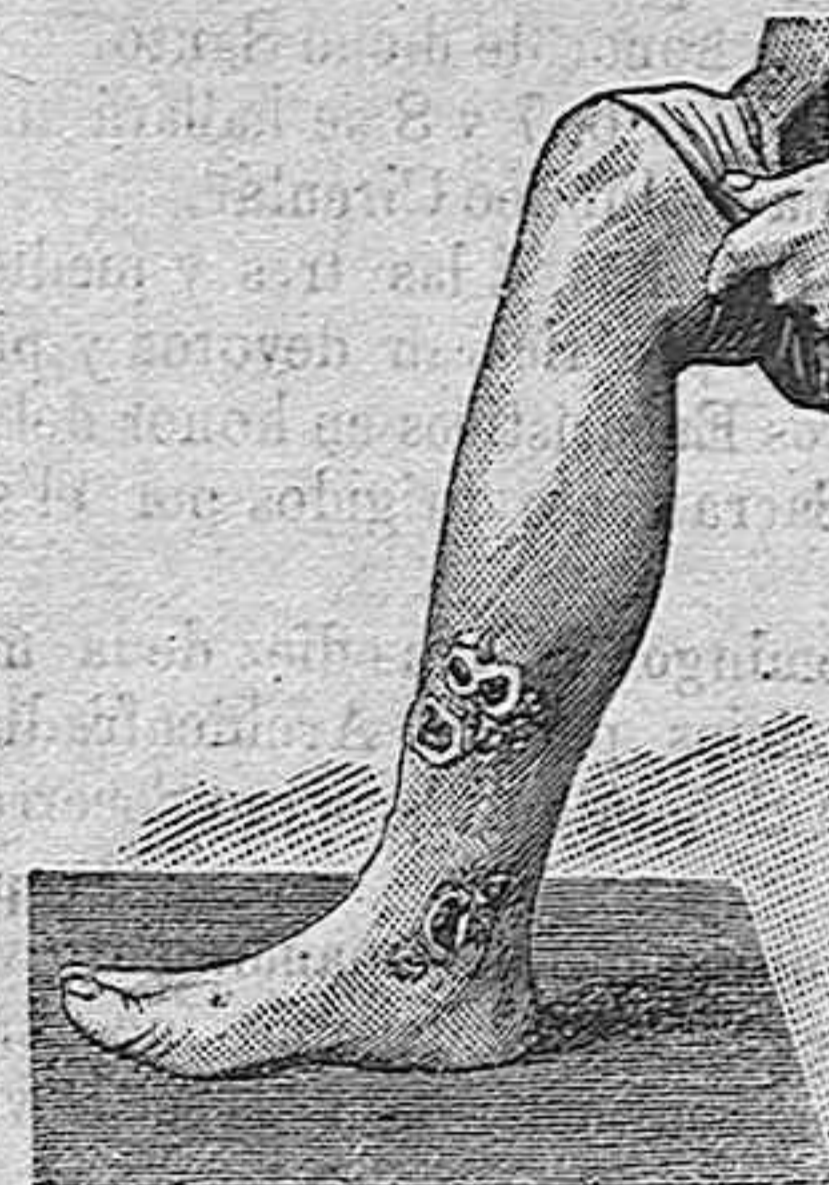
Antes de la curación.

Curación radical de todas las enfermedades de la piel, de las llagas de las piernas y de Artritis, Reumatismo, Gota, dolores, etc., por medio del Tratamiento de L. RICHELET