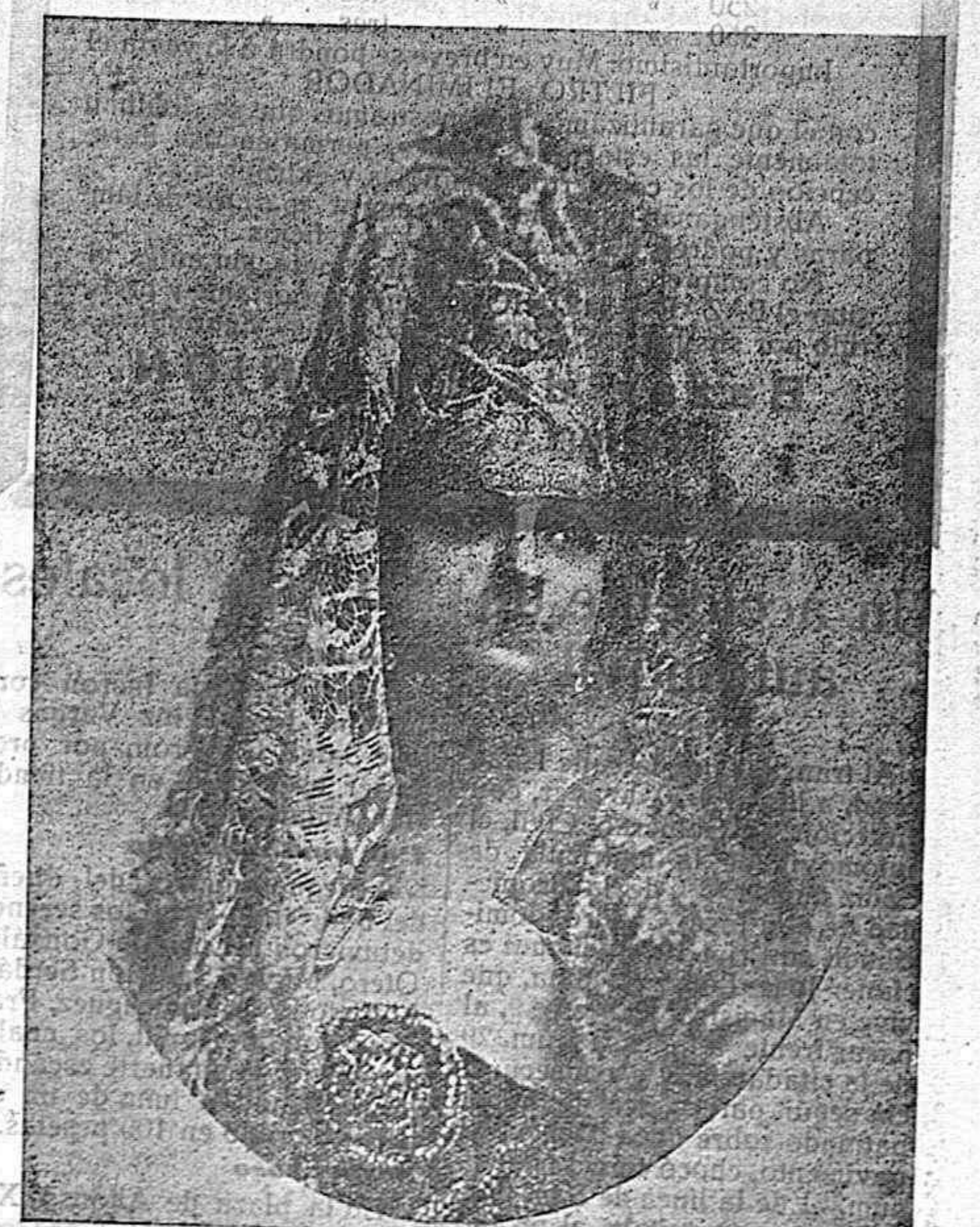
DORA LA CORDOBESITA EN UNO DE SUS MÁS APLAUDIDOS COUPLÉS