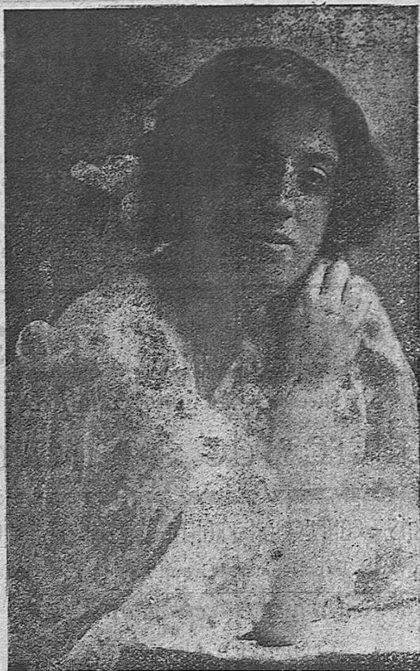
LA CARTAGINESA. Aplaudida bailarina.