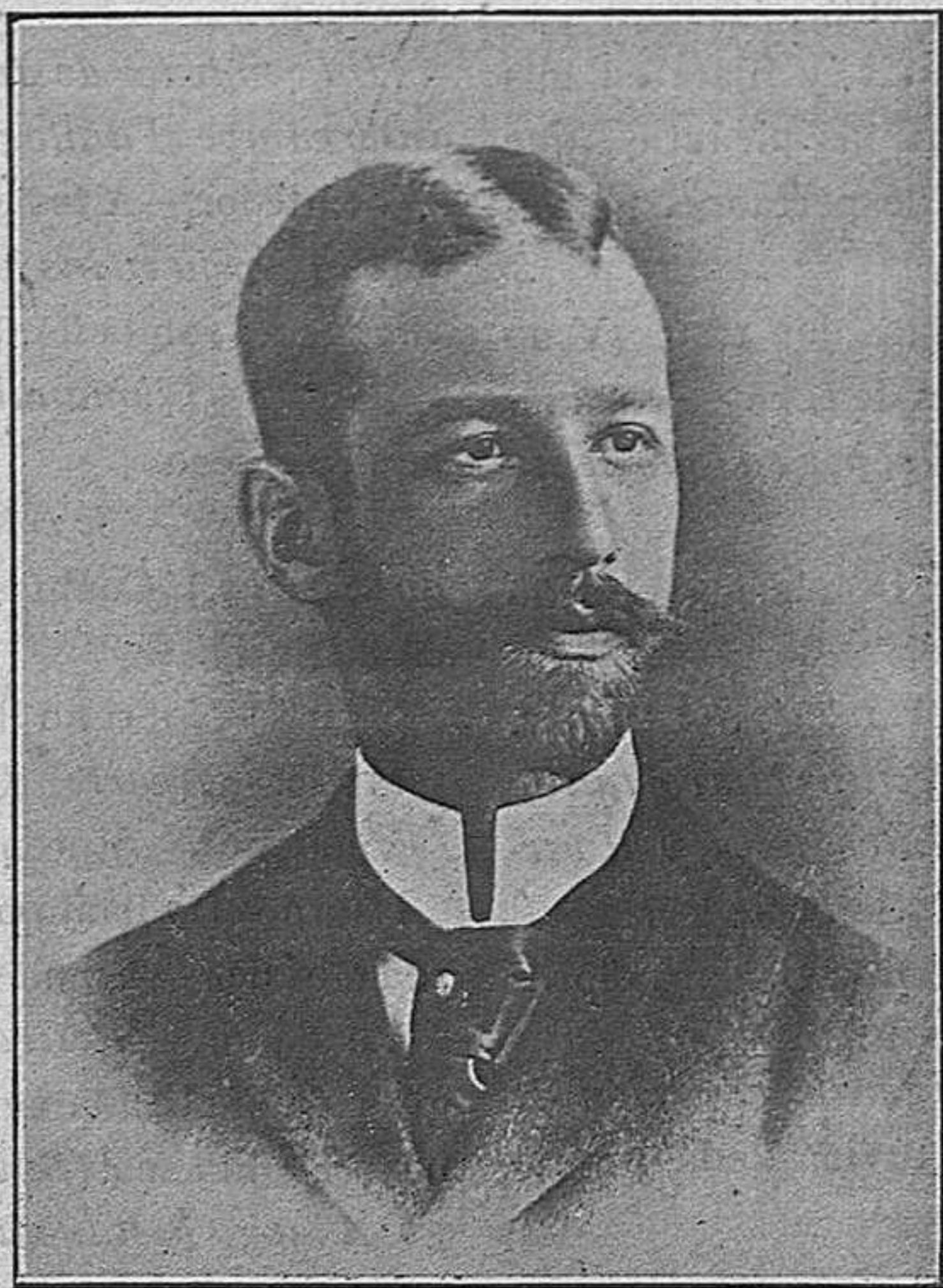
SR. D. MARIO G. MENOCAI

Electo Presidente de la República de Cuba.