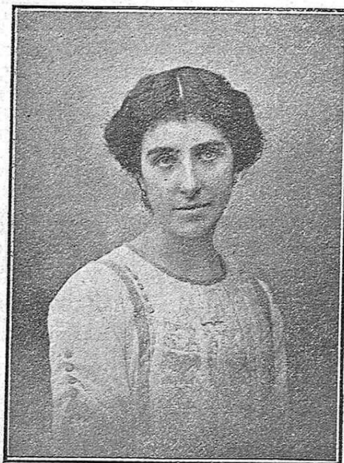
Señorita de Lacave. Dama de honor.