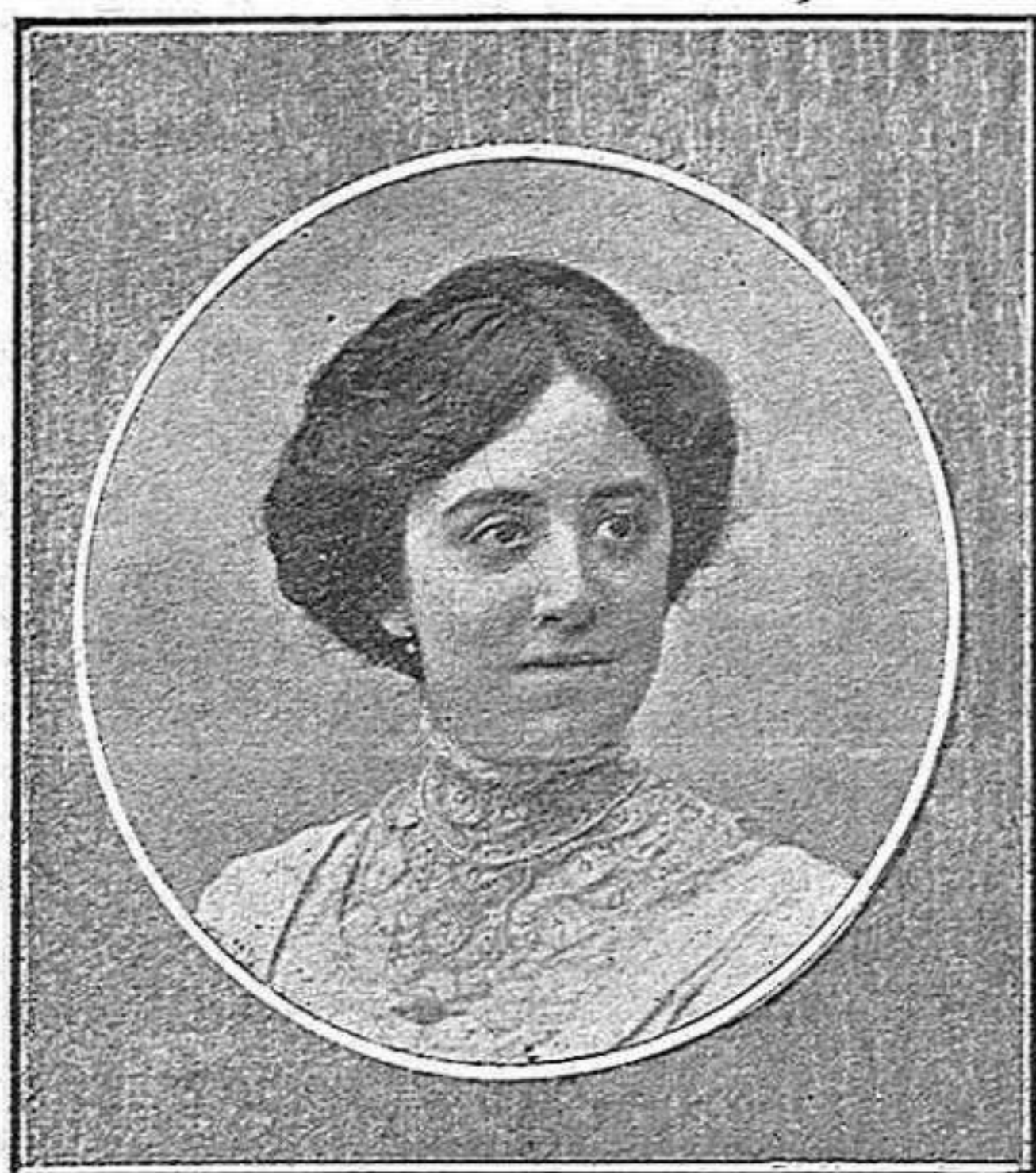
Señorita de Abarzuza. Dama de honor.