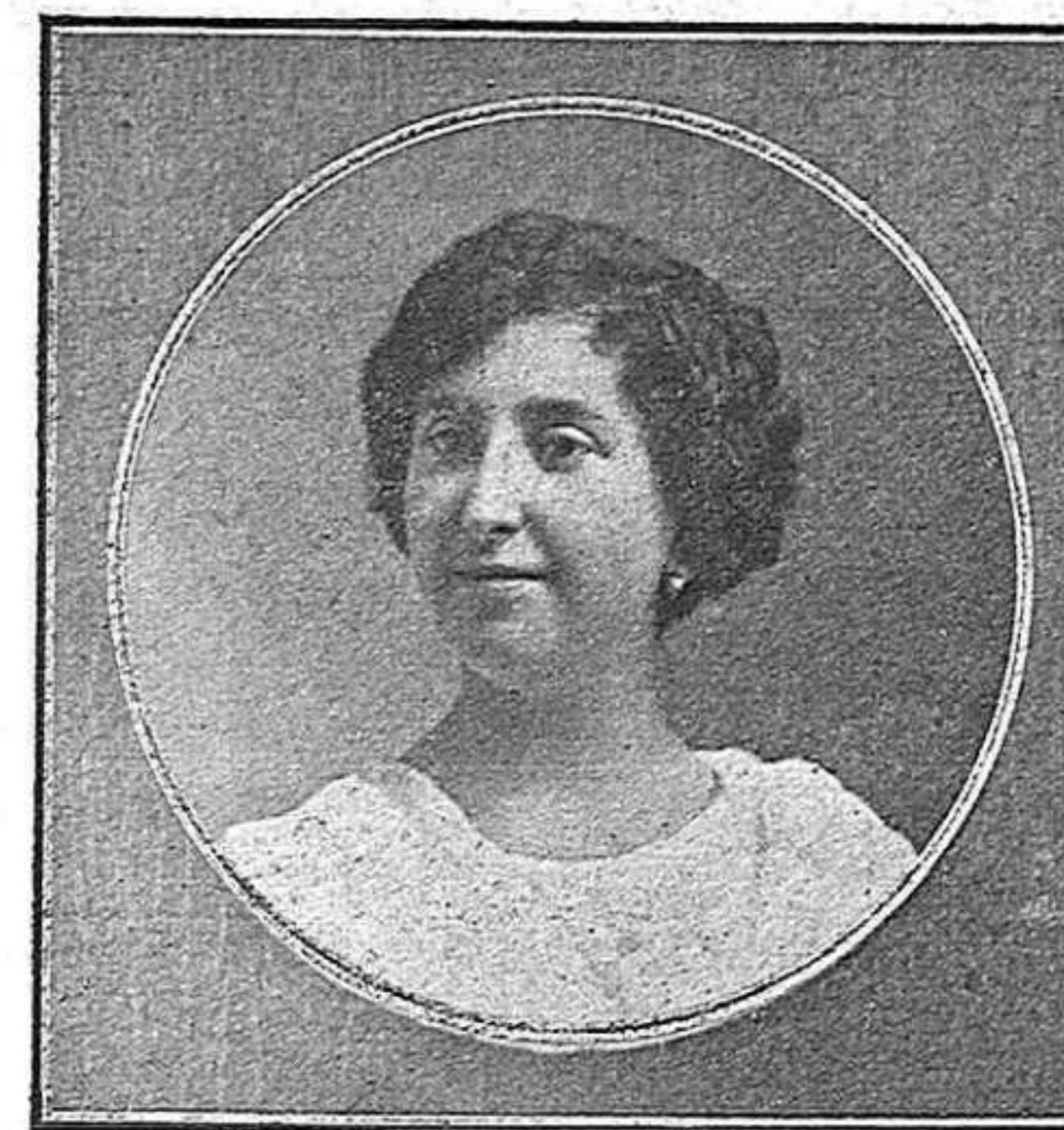
Señorita de Marengo. Dama de honor.