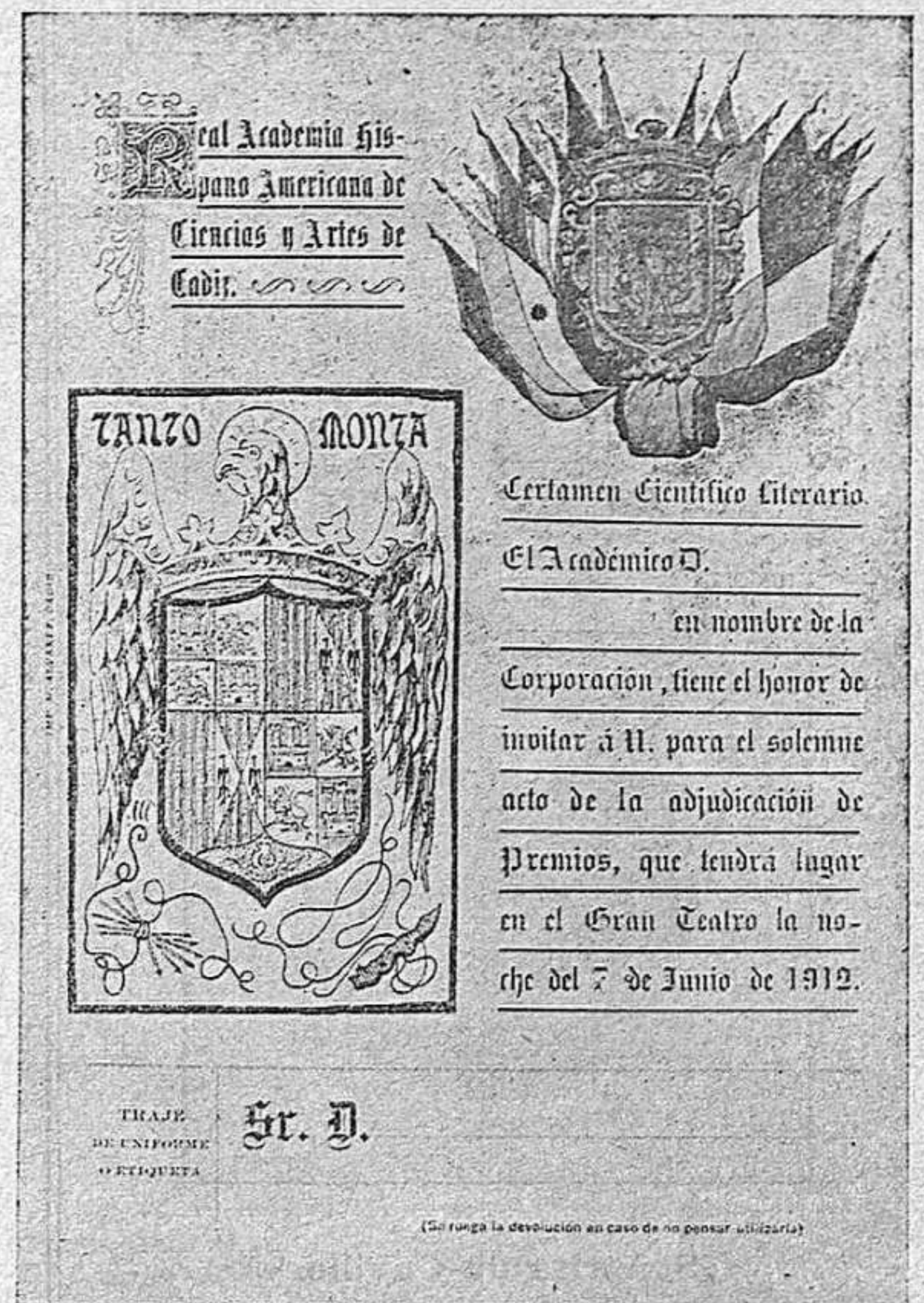
Facsimil de la invitación para el acto.