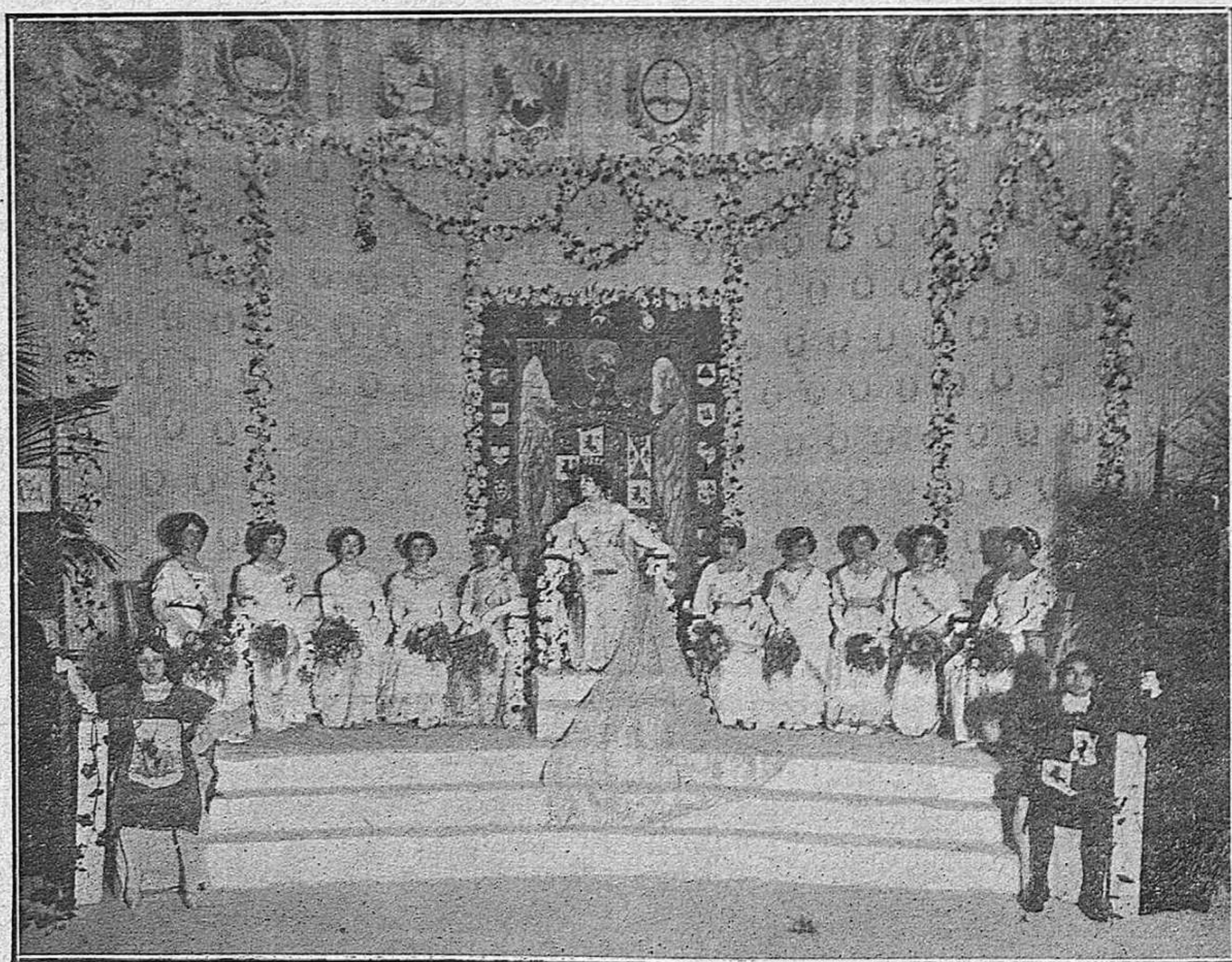
La Reina de la fiesta y su Corte de honor.