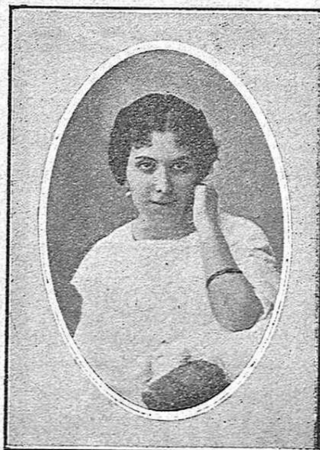
Señorita de Cuvillo. Dama de honor.