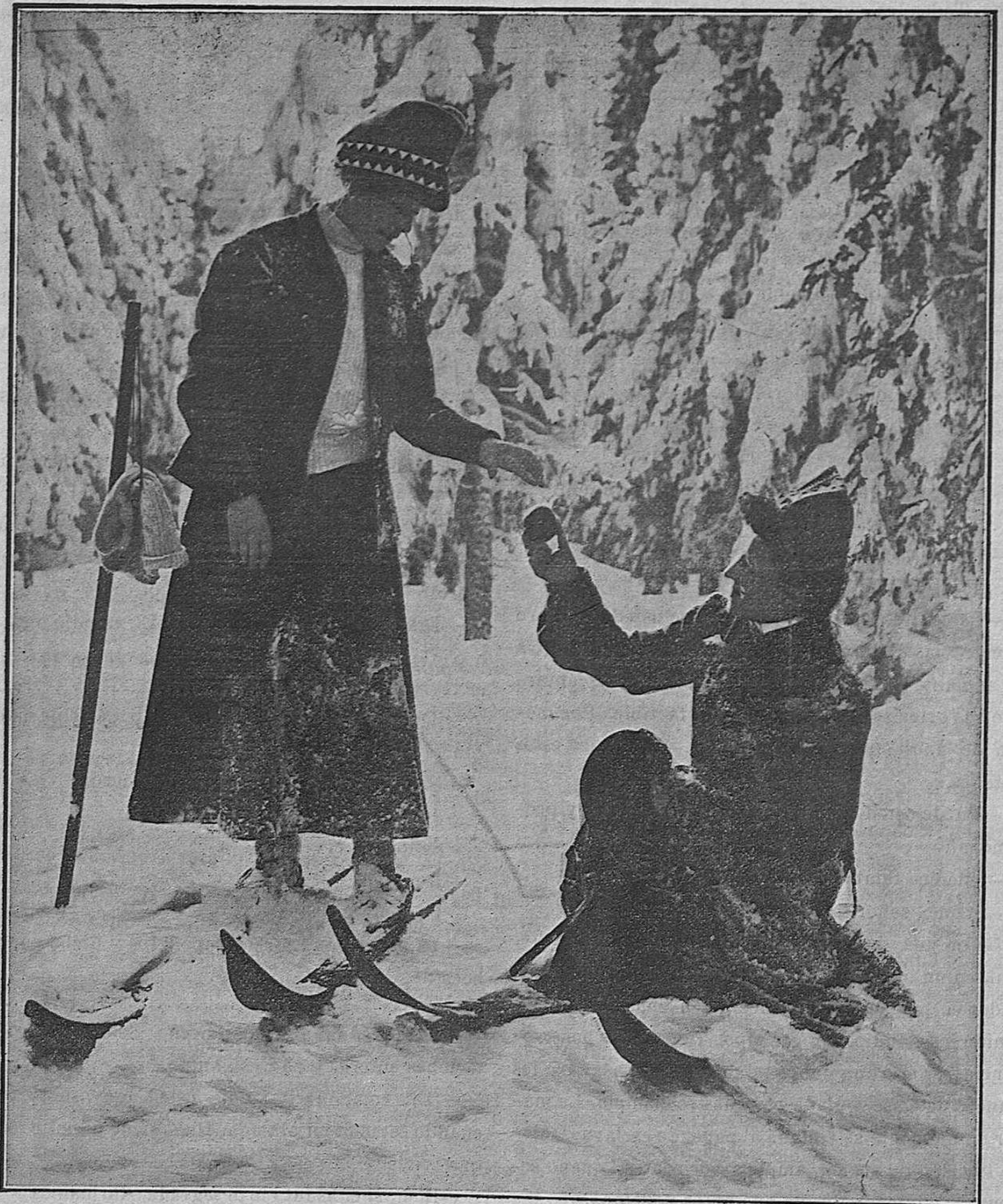
Los sports del invierno: Jóvenes con skis, sobre la nieve.