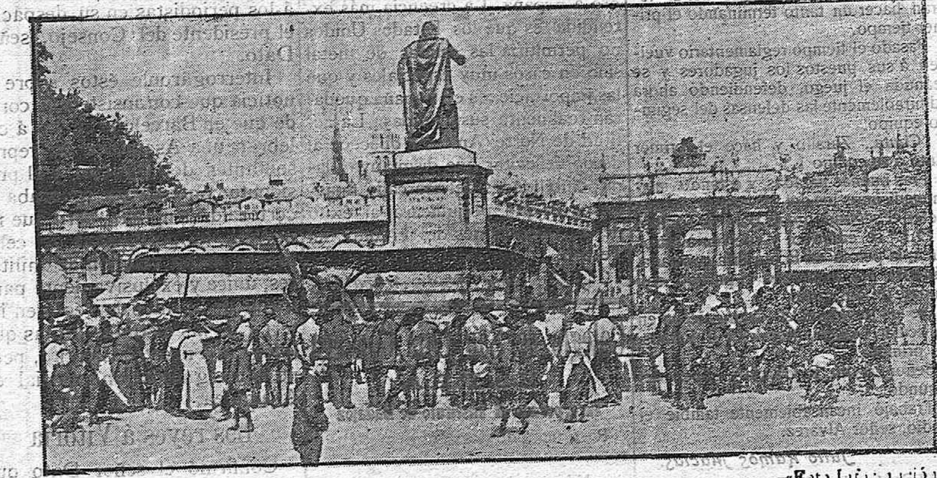
DE LA GUERRA.—Avión alemán en Nancy