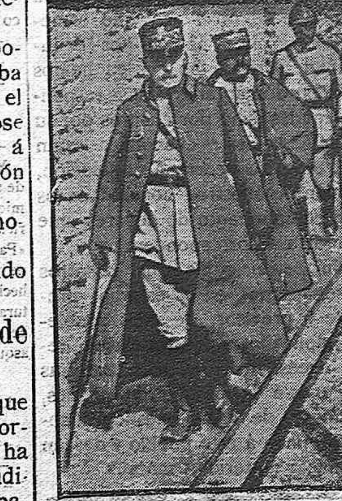
DE LA GUERRA.—El general Pétain.