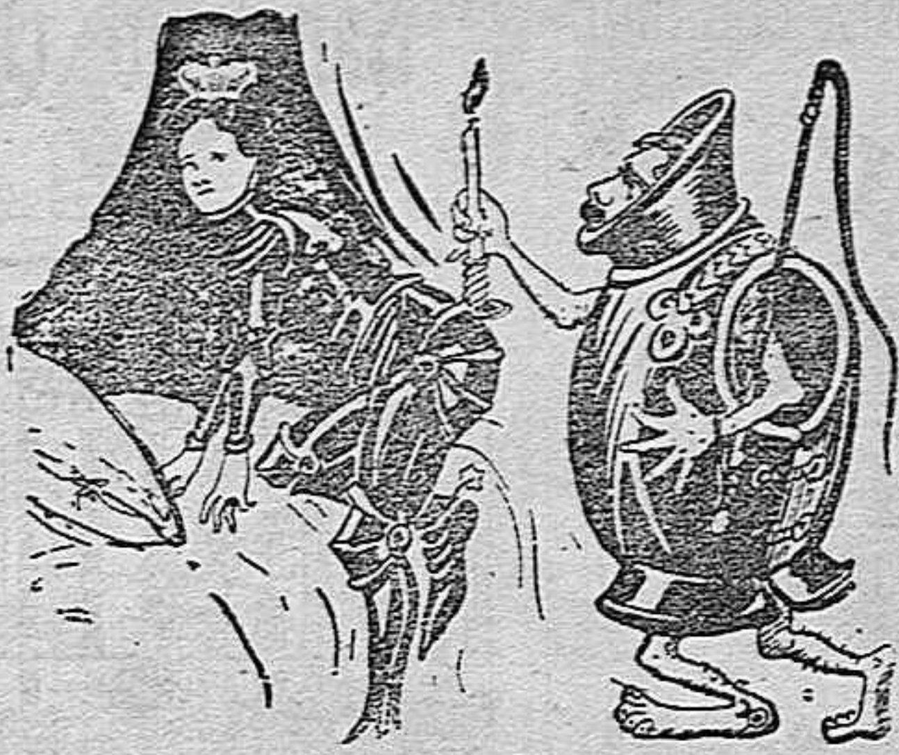
(La emperatriz).—¿Vas á acostarte con la coraza de Pedro el Grande? (El zar).—Mira, yo soy muy estudioso y no ol- vido nunca la historia de Alejandro de Servia.

Sábese que el maestro Clavijo, compuso varias obras, tanto religiosas, como profa- nas, pero desgraciadamente, ninguna se ha conservado hasta el día. El horroroso incen- dio que tuvo lugar en el antiguo real palacio el año 1734, redujo á cenizas cuantas obras existían en los archivos musicales de