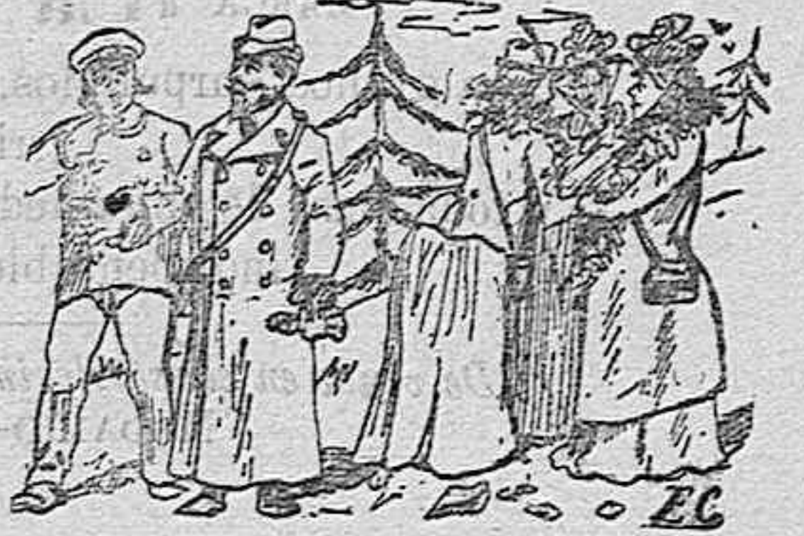
En el Niágara:

Respondiendo esta Redacción á los constantes favores de que es objeto por parte del público, tiene sometidas á estudio importantes reformas que serán un hecho en los comienzos del próximo año, y que deseamos sean del agrado de nuestros lectores.