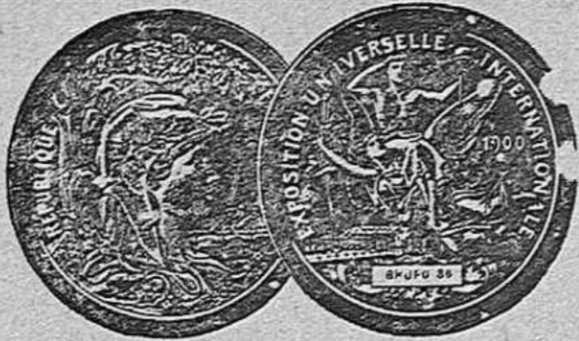
Medalla de Plata en la Exposición de París de 1900.