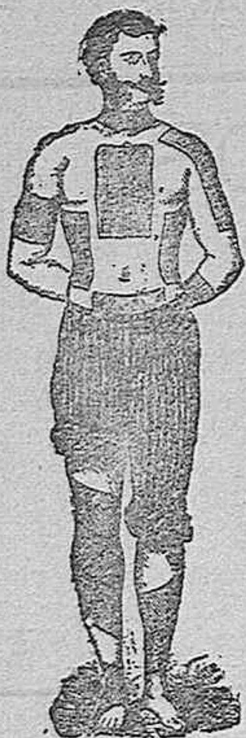
Trade Mark Registered.