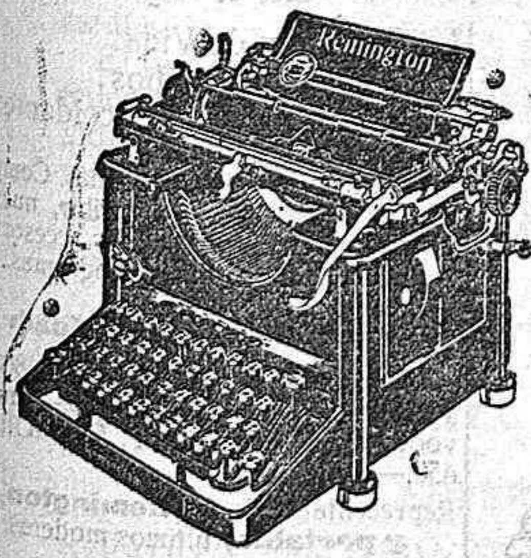
Máquina de funcionamiento silencioso

EN LOS 52 AÑOS QUE LLEVA DE PRÓSPERA EXISTENCIA LA CASA HA LOGRADO QUE SUS ÚLTIMOS MODELOS HAYAN SIDO ACLAMADOS UNIVERSALMENTE COMO LOS MÁS COMPLETOS, PRÁCTICOS Y SÓLIDOS : PIDA V. HOY MISMO CATALOGOS EXCLUSIVA DE VENTAS PARA EXTREMADURA Y SALAMANCA