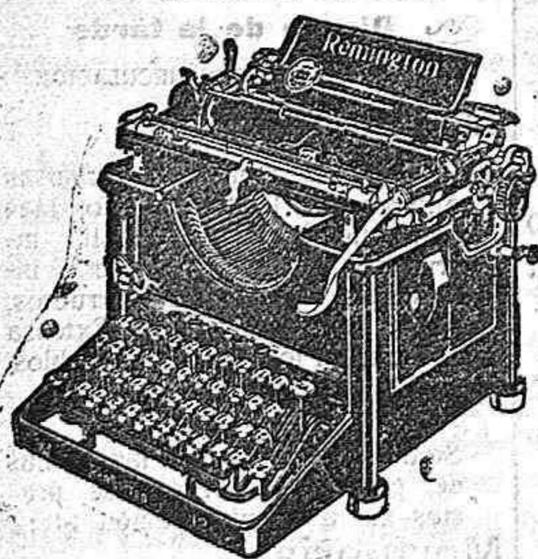
Máquina de funcionamiento silencioso

EN LOS 52 AÑOS QUE LLEVA DE PRÓSPERA EXISTENCIA LA CASA